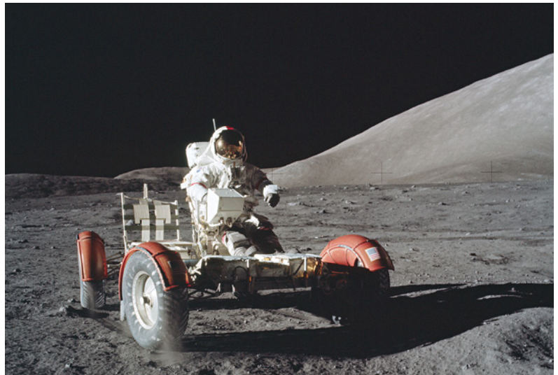
— DAS APOLLO-PROJEKT Die Abenteuer der Astronauten