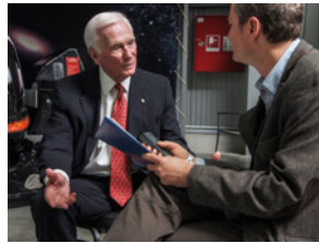
Juni 2013 Thorsten Dambeck (rechts) im Interview mit Astronaut Eugene Cernan. Der letzte Mensch auf dem Mond wurde 82 Jahre alt.

Die Pläne der Volksrepublik sind langfristig angelegt, dort denkt man nicht in Legislaturperioden, sondern in Jahrzehnten. Wenn der Betrieb der ISS in der Mitte der kommenden Dekade ausläuft, werden Taikonauten in einer neuen chinesischen Station die Erde umrunden. Bemannte chinesische Mondflüge könnten etwa im Jahr 2030 folgen, so ist es zu hören.