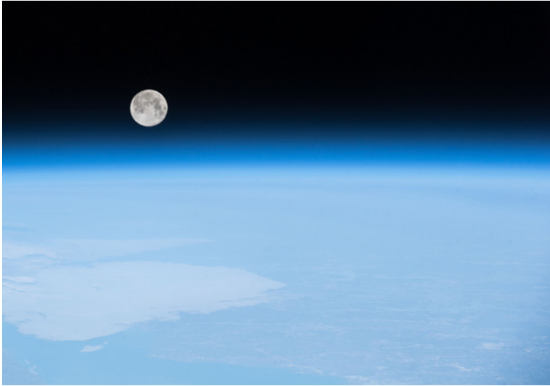
— WETTLAUF INS ALL Zehn Jahre bis zum Mond