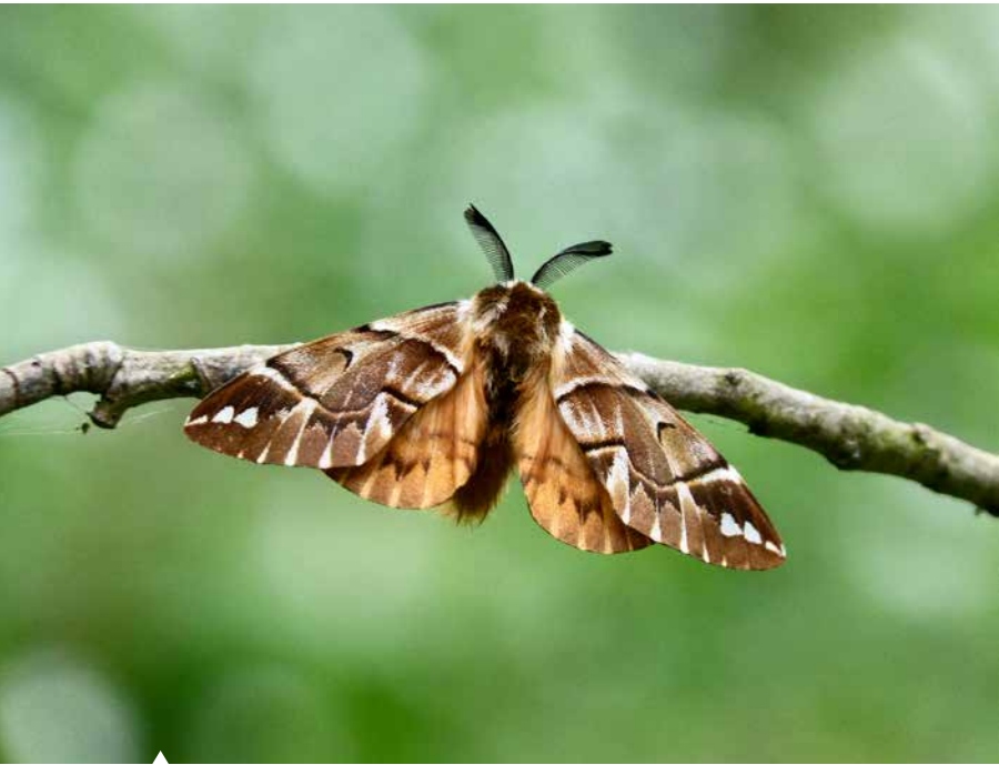
Das Birkenspinner-Männchen zeigt seine Radarantennen-Fühler.

Schmetterlinge sind schön – aber nur die Tagfalter. Alle anderen, also die Nachtfalter, sind hässliche Motten! Und: Tagfalter fliegen tagsüber, Nachtfalter nachts. So einfach ist das für naturkundliche Laien ... Der erste Teil der letzten Behauptung stimmt. Der zweite ist, wie Sie mittlerweile wissen, nur teilweise richtig. Doch diese so scheinbar simple „Nachtfalter-Frage“ ist tatsächlich nicht leicht zu beantworten – und ich muss zur Verdeutlichung des Sachverhalts etwas weiter ausholen.