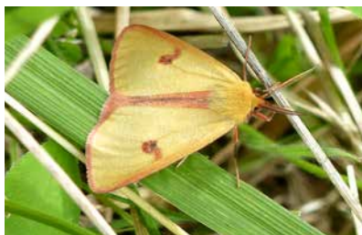
Gehören zu den TOP 15 in der „Nachtfalter-Hitparade“: Kleines Fünffleck-Widderchen (oben links), Scheck-Tageule (oben rechts), Weißer Schwarzaderspanner (unten links), Rotrandbär (unten rechts).