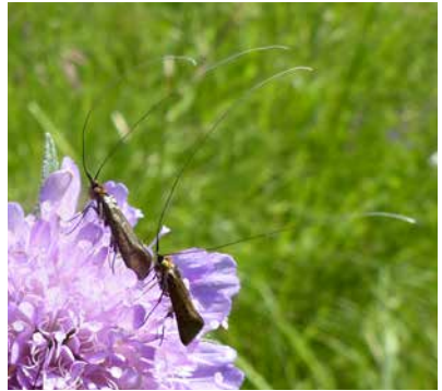
Hübsche Kleinschmetterlinge, die man häufiger am Tag beobachten kann: Federmotten ( Platyptilia gonodactyla und Pterophorus pentadactyla , oben), Nesselzünsler und Brennnesselzünsler ( Patania ruralis und Anania hortulata , Mitte), Purpurroter Zünsler ( Pyrausta nivalis ) und Langhornmotte ( Nemophora metallica ), unten – jeweils von links nach rechts