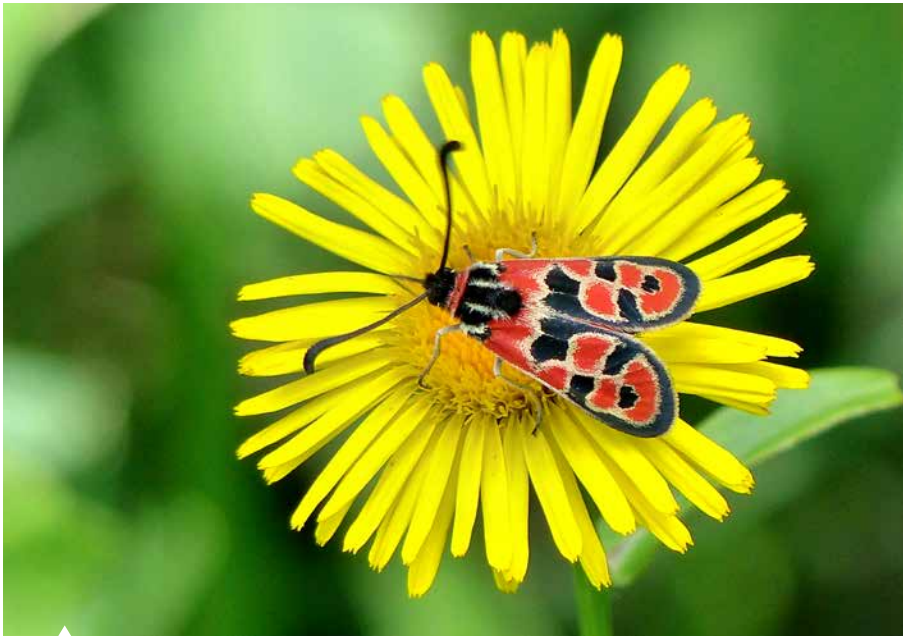
Rot-gelbe Symphonie: ein Glücks-Widderchen