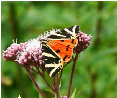
Der Russische Bär, ein großer tagaktiver Nachtfalter.

Tagfalter: Kleiner Fuchs, Gewöhnlicher Gelbling, Aurorafalter, „kleine“ Weißlinge