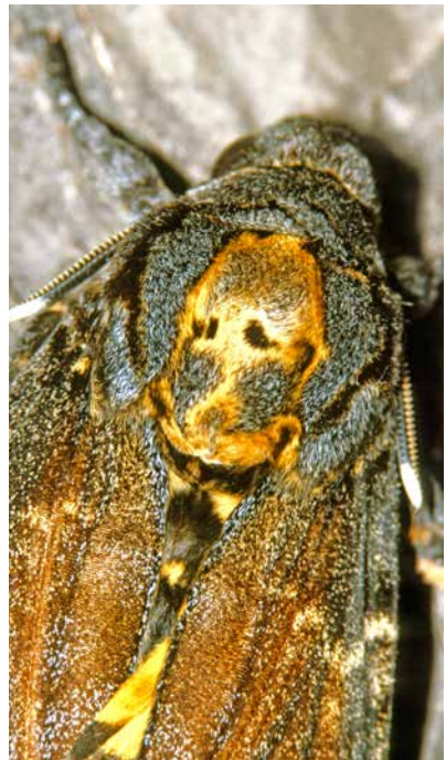
Die Schwärmer sind die Düsenjets unter den Schmetterlingen: Kieferschwärmer (links) und Totenkopfschwärmer (rechts).

Aufwand und nach einer jahrelangen Einarbeitungszeit am Stereomikroskop (Binokular) voneinander unterscheiden. Mit fast 2300 Arten gehören tatsächlich über 60 %, also fast zwei Drittel, aller etwa 3600 in Deutschland nachgewiesenen Schmetterlingsarten zu den Kleinschmetterlingen.