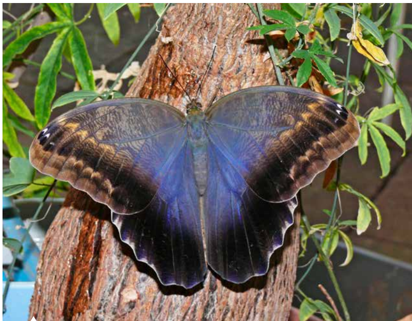
Der südamerikanische Bananenfalter, ein „Nachtaktiver Tagfalter“.

Ich sitze am Schreibtisch und brüte an einer guten Einführung für dieses Buch. Nichts fällt mir ein. Aber da habe ich ja noch den Kommentar eines Freundes im Kopf: „Schreib doch ein Buch über „Nachtaktive Tagfalter“ – da bist Du wesentlich schneller fertig!“ Womit er zweifellos Recht hat. Denn da bin ich quasi bei null Arten.