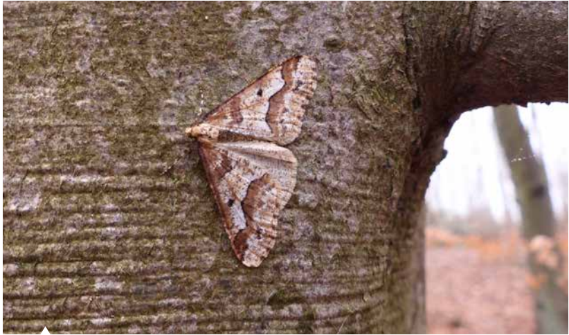
Nachtaktiv aber tagsüber leicht zu beobachten: der sehr häufige Große Frostspanner.

—Die Falter fliegen häufiger aktiv bei bedecktem Himmel bzw. trübem, regnerischem oder schwülem, heißem Wetter.