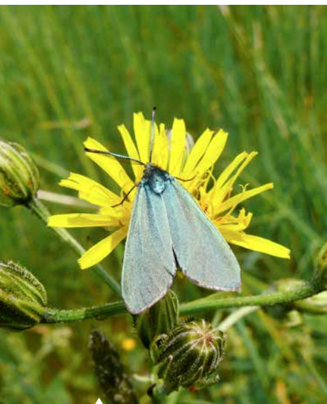
Das Gewöhnliche Grünwiderchen ist das häufigste Grünwiderchen.

Und was die Sache noch schwieriger macht: Es existiert tatsächlich eine große Grauzone, was tagaktiv ist und was nicht. Allein schon, um die Kriterien für die „Tagaktivität“ zu definieren, benötigte ich über ein Jahr. Noch schwieriger war es dann, eine möglichst vollständige Gesamtartenliste für die tagaktiven Nachtfalter zu erstellen. Trotz größter Sorgfalt meinerseits und Hinweisen von Dutzenden Experten werden einige Spezialisten die Einstufung von bestimmten Arten aufgrund ihrer persönlichen Erfahrung in ihrer Region hinterfragen oder gar als fehlerhaft ansehen. Oder sie werden auf fehlende Arten verweisen. Aber was könnte besser sein als eine Liste, die zum Widerspruch reizt? Und die im Lauf der Jahre fortgeschrieben und somit immer weiter verbessert werden kann.