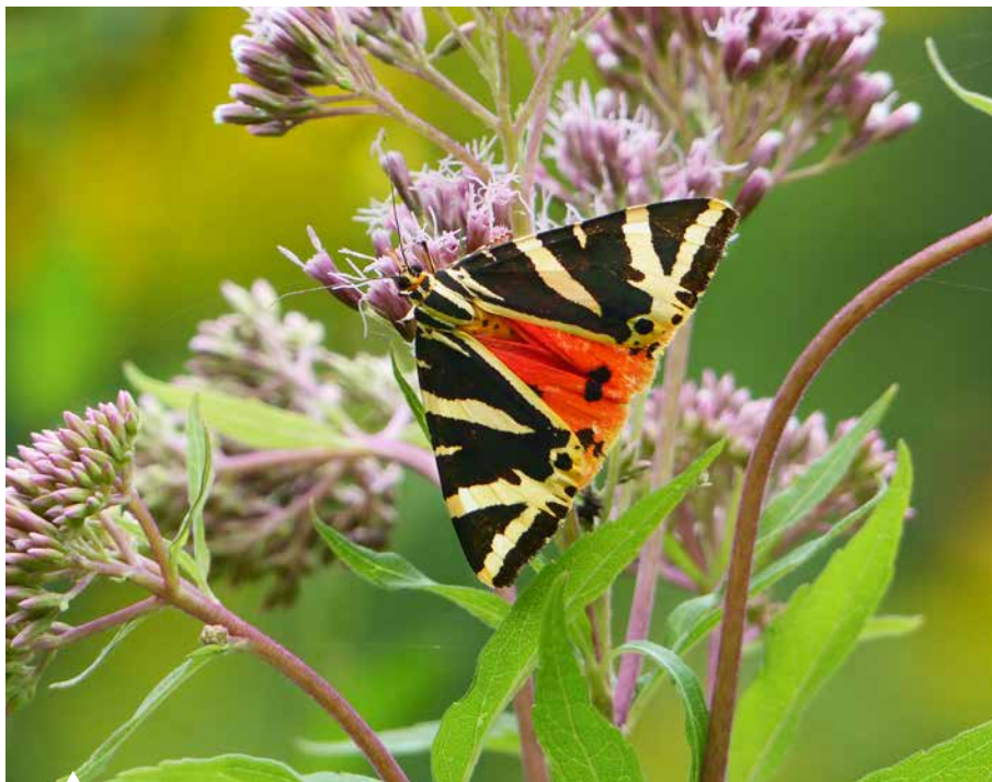
Saugt mit Vorliebe an Wasserdost: der wunderschöne Russische Bär.

(tagsüber leicht aufzuscheuchen) viele Zwerg- und Grünspannerarten, Ordensbänder, einige Band- und Graseulen