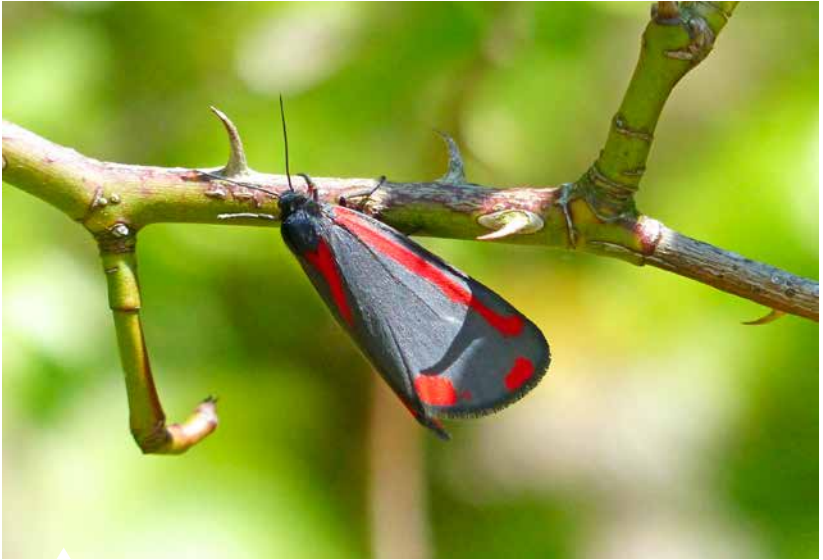
Der Jakobskrautbär zeigt seine schwarz-rote Warntracht.