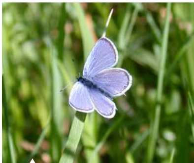
Der Kurzschwänziger Bläuling, ein sehr kleiner Tagfalter.

Tagfalter: kleinste Bläulinge (Zwerg-Bläuling, Kurzschwänziger Bläuling), kleinste Dickkopffalter (Gewöhnlicher Würfelfalter)