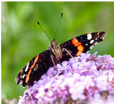
Der Admiral, ein großer Tagfalter.

Tagfalter: Bläulinge, Dickkopffalter, Wiesenvögelchen