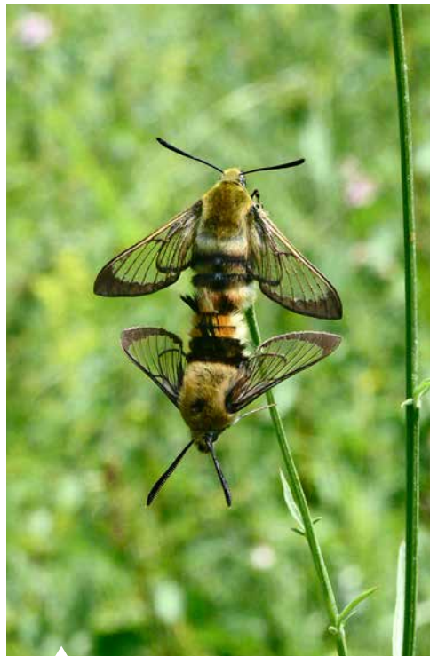
Skabiosenschwärmer bei der Paarung

Bei den in den Artenporträts beschriebenen Arten hilft zusätzlich zum Freilandfoto ein Foto eines Sammlungsexemplars (mit Nummer) bei der Bestimmung der Art. Auch von der zuerst beschriebenen ähnlichen bzw. verwandten Art (mit Zusatznummer „a“) wird ein Sammlungstier abgebildet. Alle im Buch aufgeführten Arten werden zusätzlich zum besseren Vergleich auf Bestimmungstabellen (in originalgetreuen Größen) abgebildet. Zusätzlich werden sie mit genauem deutschen und wissenschaftlichen Namen sowie dem Grad der Tagaktivität in einer Artenliste, die die systematische Stellung der Arten verdeutlicht, dargestellt. Jede im Buch aufgeführte Art hat ihre eigene Nummer . Die Arten werden auf den Sammlungsfotos, den Freilandfotos, in der Artenliste sowie im