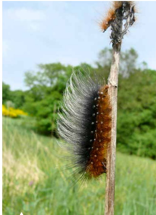
Die haarige Raupe des Braunen Bären macht ihrem Namen alle Ehre.