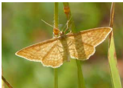
Eulen (Braune Tageule, links) ... und Spanner (Ockerfarbiger Steppenheiden-Zwergspanner, rechts)