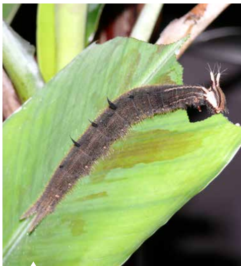
Die 10 cm langen Raupen hatten einen riesigen Appetit.