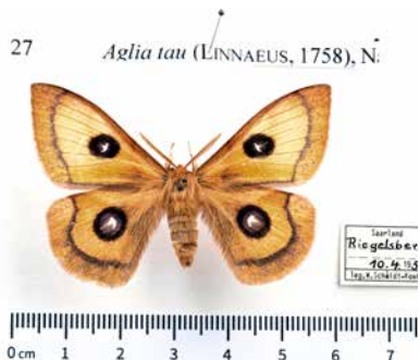
Sammlungsfoto eines Nagelflecks in Rohform.

Im Text des Artenporträts werden die Merkmale und die Größe des Falters, die beide für die Bestimmung wichtig sind, angegeben. Bei den Eulenfaltern wird die typische „Eulenzeichnung“ im einführenden Kapitel erklärt. In Bestimmungsbüchern wird die Größe