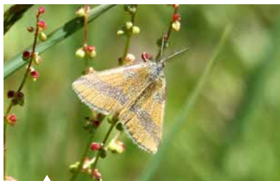
Der Ampfer-Purpurspanner, ein sehr kleiner, rein tagaktiver Nachtfalter.

Russischer Bär, Hausmutter, Eichenspinner Tagfalter: Admiral, Distelfalter, Tagpfauenauge, Zitronenfalter