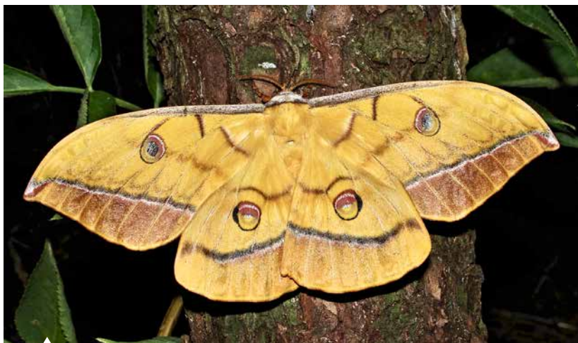
Riesig und einfach prächtig: Der Neubürger Japanischer Eichenspinner ist an der Donau bei Passau heimisch geworden.