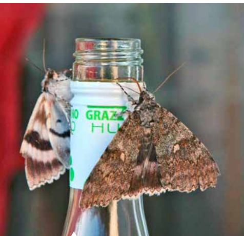
Blaue Ordensbänder schlürfen gern Wein und Bier.

In der nachfolgenden Auflistung ist schön zu sehen, wo die einzelnen Familien im modernen wissenschaftlichen System stehen (nach www.lepiforum.de – 2018) und welche Gruppen eng miteinander verwandt sind. Die Einteilung der Schmetterlinge und die Bestimmung des Verwandtschaftsgrades erfolgt hauptsächlich nach verschiedenen anatomischen Merkmalen, insbesondere des „Skeletts“ und der Körperanhänge. Wichtig sind auch das Flügelgeäder, die Beborstung der einzelnen Beine sowie die Merkmale der Raupen und Puppen.