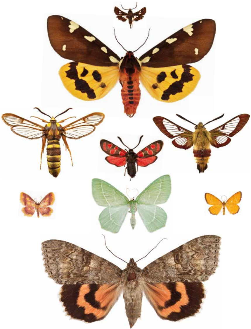
Eine Auswahl an bunten, unterschiedlich großen tagaktiven Nachtfliegen (von oben nach unten und links nach rechts): Waldreben-Fensterfleckchen (sehr klein); Augsburger Bär (sehr groß); Hornissen-Glasflügler (mittelgroß), Esparsetten-Widderchen (klein), Hummelschwärmer (mittelgroß); Purpurstreifen-Zwergspanner (sehr klein), Waldreben-Grünspanner (mittelgroß), Orangelber Magerrasen-Zwergspanner (sehr klein); Rotes Ordensband (sehr groß).