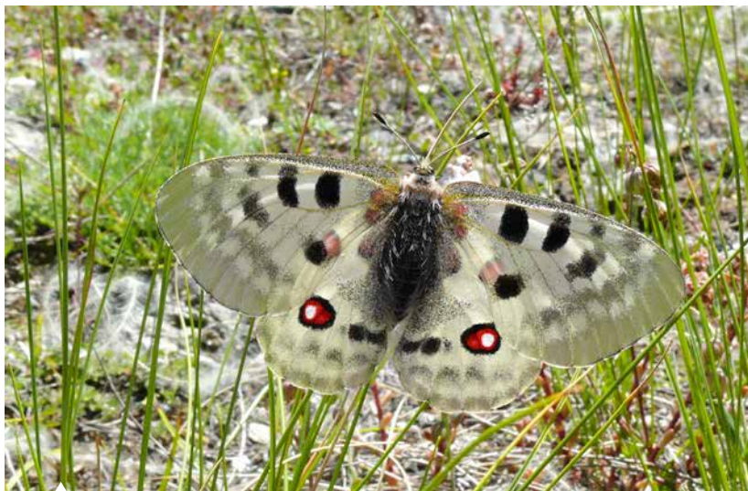
Der sehr große Apollo ist einer der prächtigsten Tagfalter.

Tagaktive Nachtfalter. Bei oberflächlicher Betrachtung ist das ein ziemlich verrückter Titel für ein Schmetterlingsbuch. Quasi ein Widerspruch in sich. Gibt es wirklich Nachtfalter, die tagsüber fliegen? Eindeutige Antwort: Jaaaa!! Und es sind sogar viele Arten. Denn sonst hätte ich das Buch ja nicht geschrieben. Das Erstaunliche an den Nachtfaltern ist: Sie sind im Gegensatz zu den Sonnenkindern, den Tagfaltern, zu unterschiedlichen Tages- und Nachtzeiten aktiv.