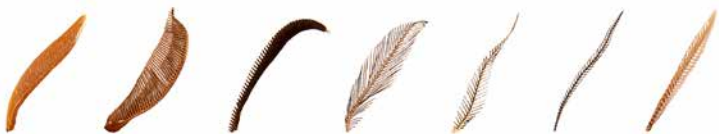
Tagaktive Nachtfalter haben mannigfaltige Fühlerformen – zum Vergleich zwei Tagfalterfühler (obere Reihe ganz links und 2. von links).