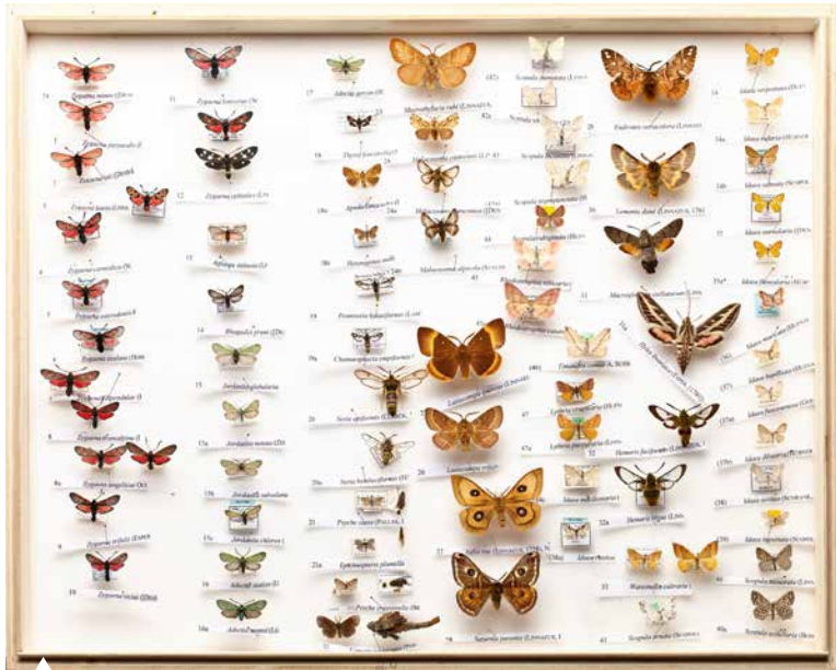
Die Falter aus einer wissenschaftlichen Sammlung wurden für die Tafeln einzeln fotografiert.