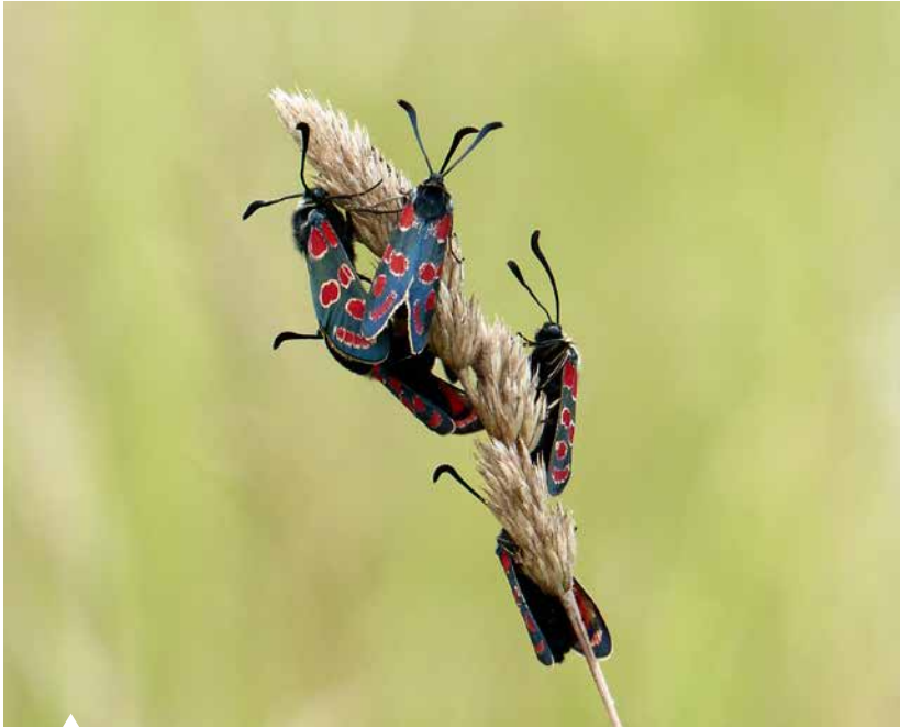
Das Esparsetten-Widderchen, eines der schönsten Blutströpfchen, bildet Schlafgemeinschaften.