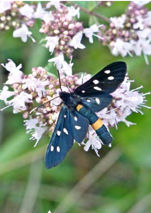
Das Weißfleck-Widderchen ahmt ein Blutströpfchen nach, ist aber ein Bär.

tagaktiven Grünspanner haben durchgängig grün gefärbte Flügel – das gibt es bei keinem Tagfalter in Deutschland. Der Smaragd-Grünspanner gehört, nicht nur aufgrund seines Namens, zu den schönsten tagaktiven Nachtfaltern. Einige Baumspanner sehen aus wie Harlekine oder tarnen sich als Vogeldeck. Andere sind knallgelb oder haben, wie der Pantherspanner, ein Fleckenmuster wie eine Raubkatze auf ihren Flügeln. Die Frostspanner gehören mit zu den häufigsten Nachtfaltern. Sie sind zwar ausschließlich nachtaktiv, man kann sie tagsüber aber selbst in Großstädten zu Dutzenden an beleuchteten Schaufenstern finden. Ihre Weibchen sind vollkommen flügellos. Sie krabbeln an Baumstämmen hoch und warten hier auf die anfliegenden Männchen.