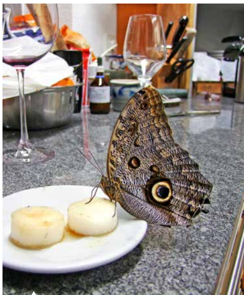
In der Küche fütterten wir unseren Banani mit Honigwasser.