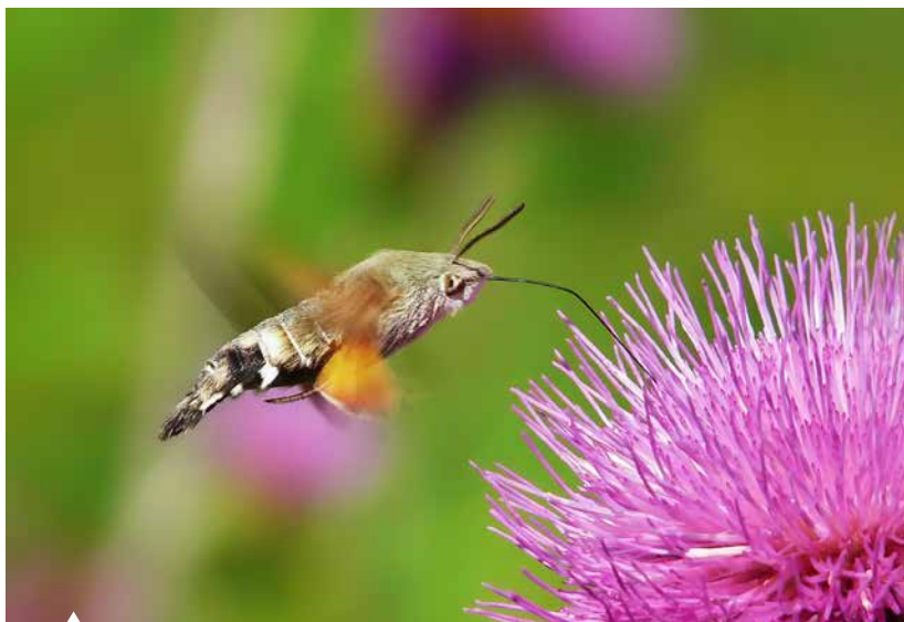
Das Taubenschwänzchen „steht“ wie ein Kolibri vor den Blüten.

In diesem Buch werden erstmals im deutschsprachigen Raum die tagaktiven Nachtfalter Deutschlands in drei Gruppen eingeteilt und nach Familien gegliedert in Artenporträts dargestellt. Eine Hilfe bei der Auswahl lieferte neben meinen, durch langjährige Freilanderfahrung gewonnenen Erkenntnissen, den Informationen von Spezialisten und Angaben aus der Fachliteratur und Websites auch die Auswertung der Daten des Tagfalter-Monitorings , das vom Helmholtz-Institut für Umweltforschung (UFZ) in Halle koordiniert wird ( www.tagfalter-monitoring.de ).