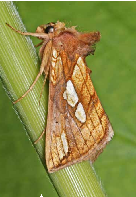
Hat leuchtend goldene Metallflecke – die Röhricht-Goldeule.

Die riesigen Ordensbänder verfolgen eine andere Strategie. Sie erschrecken ihre Angreifer mit ihren auffälligen rot, gelb oder blau gefärbten Hinterflügeln – und gewinnen