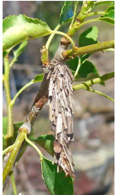
Die Raupen des Großen Sackträgers bauen sich kunstvolle „Köcher“.