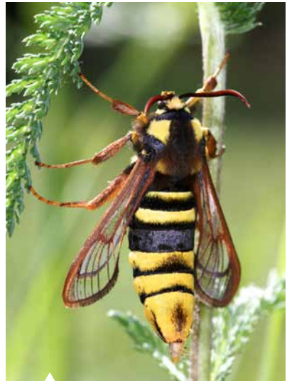
Der Hornissen-Glasflügler sieht einer Hornisse täuschend ähnlich.

Mithilfe des Buches will ich viele Menschen dazu bringen, bei ihren Tagesexkursionen in der Landschaft neben den Tagfaltern auch den vielen schönen Nachtfalterarten Beachtung zu schenken. Und ich möchte insbesondere die vielen reinen Tagfalterbeobachter auch mit den Nachtfaltern besser vertraut machen. Es wäre prima, wenn sich zukünftig mehr Menschen für die „etwas anderen