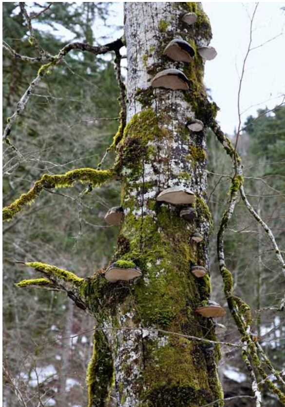
► Himmelsleiter an einem Baum: der Weg von unten nach oben

Bereits in dem ältesten Mythenkomplex, der uns bis heute schriftlich greifbar ist, in den rund 4000 Jahre alten Geschichten um die große mesopotamische Göttin Inanna-Ishtar , Königin von Himmel und Erde, Göttin der Liebe und des Kampfes, spielt solch ein entwurzelter Baum eine Rolle. Es ist der berühmte Huluppu-Baum, den die Himmelskönigin mitten aus den gurgelnden Wassern des Euphrat herauszieht. Sie pflanzt ihn in ihren Garten und sorgt für ihn wie für ihr eigenes Kind. Bereits in dieser frühen Zeit fällt auf, wie sehr das Schicksal der Göttin mit dem Wachstum des Baumes verknüpft, ja in eins gesetzt wird. Es ist ihr eigener Lebensbaum, von dem hier die Rede ist. Große Pläne hat sie mit ihm, doch der Baum