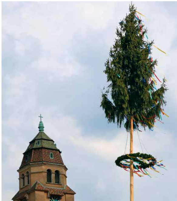
► Die Fichte, verehrt als Maibaum: Sinnbild des Weltenbaumes und seiner Entwicklungskraft