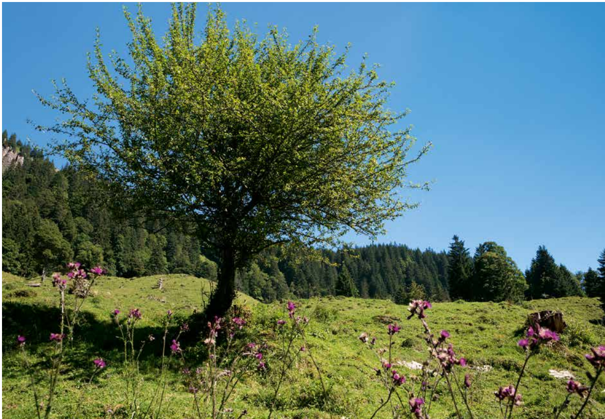
◀ Urahn: Der Wildapfel trägt bereits die runde, geschlossene Gestalt in sich.

Der mit dem paradiesischen Urbeginn des Menschen verbundene, lebenspendende Apfel war als goldener Reichsapfel jahrhundertlang Päpsten,