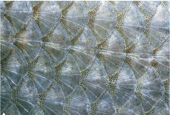
Die silbrigen Rundschuppen eines Hasels