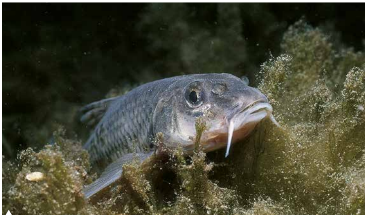
Der Gründling hat in den Mundwinkeln je eine Bartel.

knospen. Sie nehmen chemische Reize wahr und dienen dem Aufstöbern von Nahrung. Geschmackssinneszellen sind jedoch nicht nur in Barteln vorhanden, sondern auch im Maul, auf den Lippen und bei vielen Arten über die ganze Oberfläche verstreut.