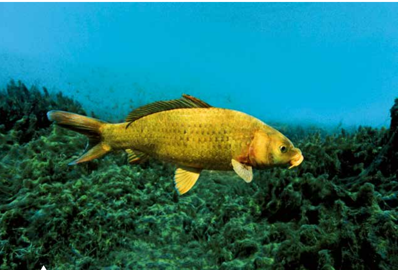
Auch beim Karpfen kommen in freier Natur solche seltenen goldfarbenen Varianten vor.

elle Verhornungen der Oberhaut dar. Meist treten sie nur beim Männchen auf oder aber sind bei diesen stärker ausgeprägt als bei den Weibchen. Ein typisches Beispiel ist der Perlfisch, der seinem markanten Laichausschlag seinen Namen verdankt.