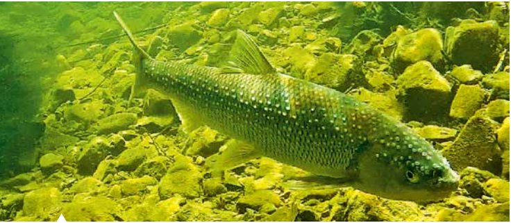
Perlfisch mit körnigem Laichausschlag