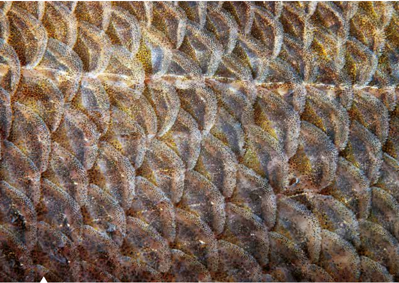
Kammschuppen eines Flussbarsches