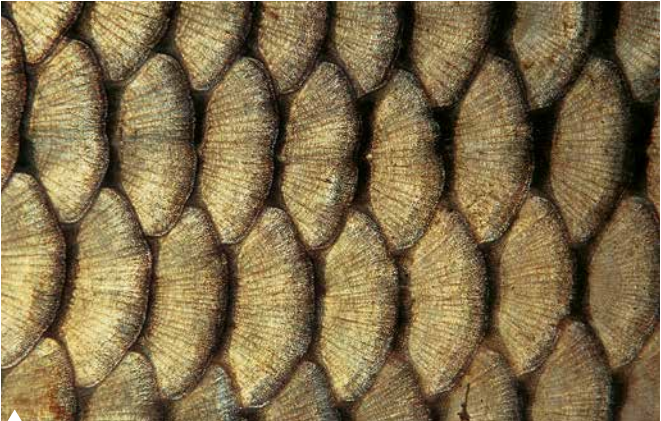
Rundschuppen eines Wildkarpfens

ten. Dies führt bei den Schuppen zur Bildung konzentrischer Ringleisten (Wachstumsringe, ähnlich den Jahresringen bei Baumstämmen), wobei die im Sommer angelegten größere Abstände aufweisen als die im Winter gebildeten.