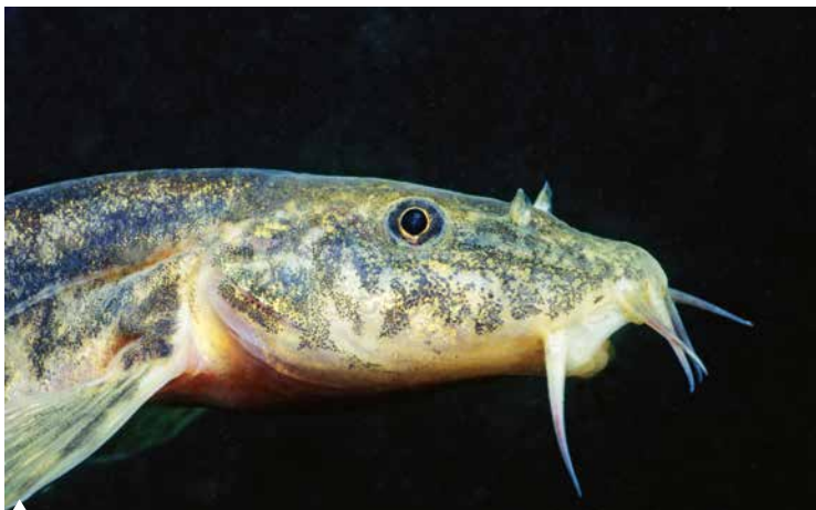
Die Schmerle hat sechs Barteln an der Oberlippe.