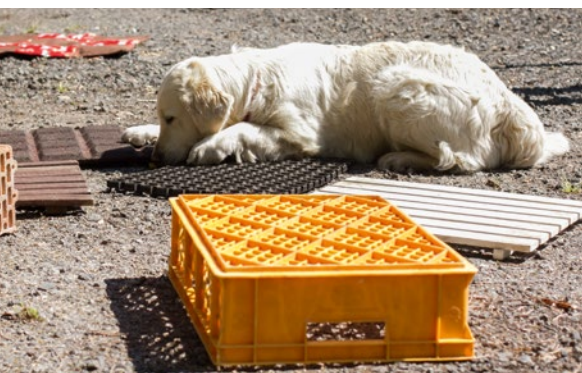
05 Gefunden! Der Hund zeigt an.