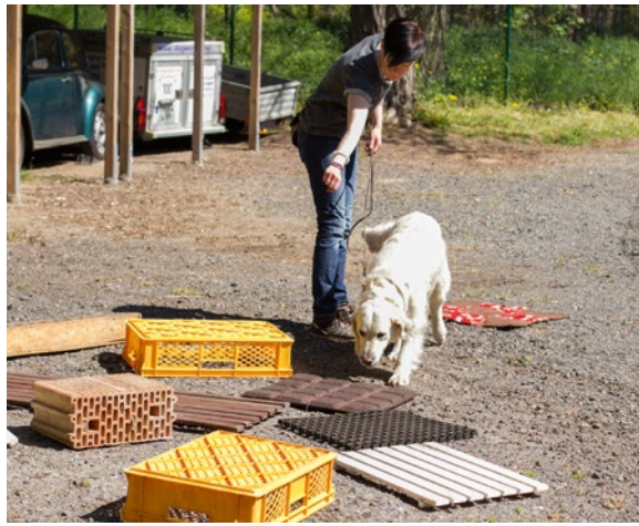
04 Die Suche nach dem ZOS®-Gegenstand beginnt.

Hundes erhöht und gleichzeitig der zu suchende ZOS®-Gegenstand exakt benannt. Beispiel: Für die Suche nach einer Wäscheklammer (ZOS®-Gegenstand) wird mehrmals das Wort „Klammer“ verwendet und zeitgleich werden mehrfach spreizende Bewegungen zwischen Daumen und Zeigefinger vorgenommen. Jetzt weiß der Hund genau, welchen ZOS®-Gegenstand er suchen soll.