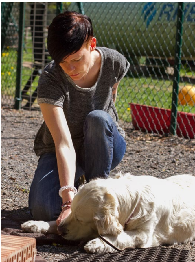
07 Die Belohnung folgt sofort.

Rückkehr Mit erneut spannungsgeladener körpersprachlicher Gestik kehrt der Hundeführer nach dem „Antäuschen“ zu seinem Vierbeiner zurück. Dann positioniert er sich neben dem Hund und wartet auf dessen Blickkontakt. Jetzt wird mit dem aus der Vorbereitung bekannten Hör- und Sichtzeichen („Klammer“) die unmittelbar bevorstehende Suche nach dem ZOS®-Gegenstand eingeleitet. Für den Start zur Suche muss der Hund jetzt nur noch „freigegeben“ werden. Dazu wird in ZOS®-Kreisen bevorzugt das Signalwort „ZOS®“ verwendet.