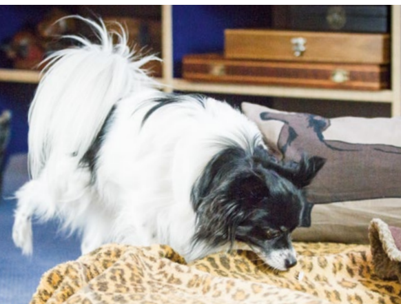
02 Im Alltag nutzt der Kleine das Bein kaum...

Einerseits ist hier zu betonen, dass die Arbeit z. B. in einem Trümmerfeld durch die ständige Beanspruchung der kleinen und kleinsten Stell- und Haltemuskeln und der mit ihnen verbundenen Sinnesorgänchen zu einer stetigen Forderung und Förderung der Körperbeherrschung führt.