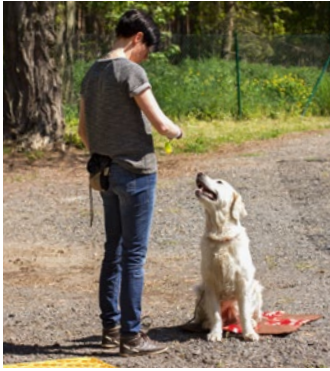
01 Startritual mit Sichtzeichen.