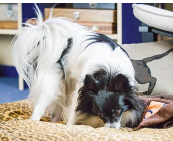
03 ...im unebenen ZOS®-Trümmerfeld schon.