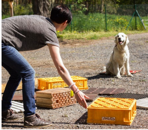
02 Antäuschen im ZOS®-Trümmerfeld.