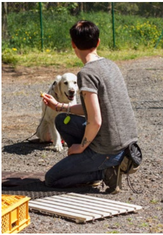
03 Unmittelbar vor dem Start.