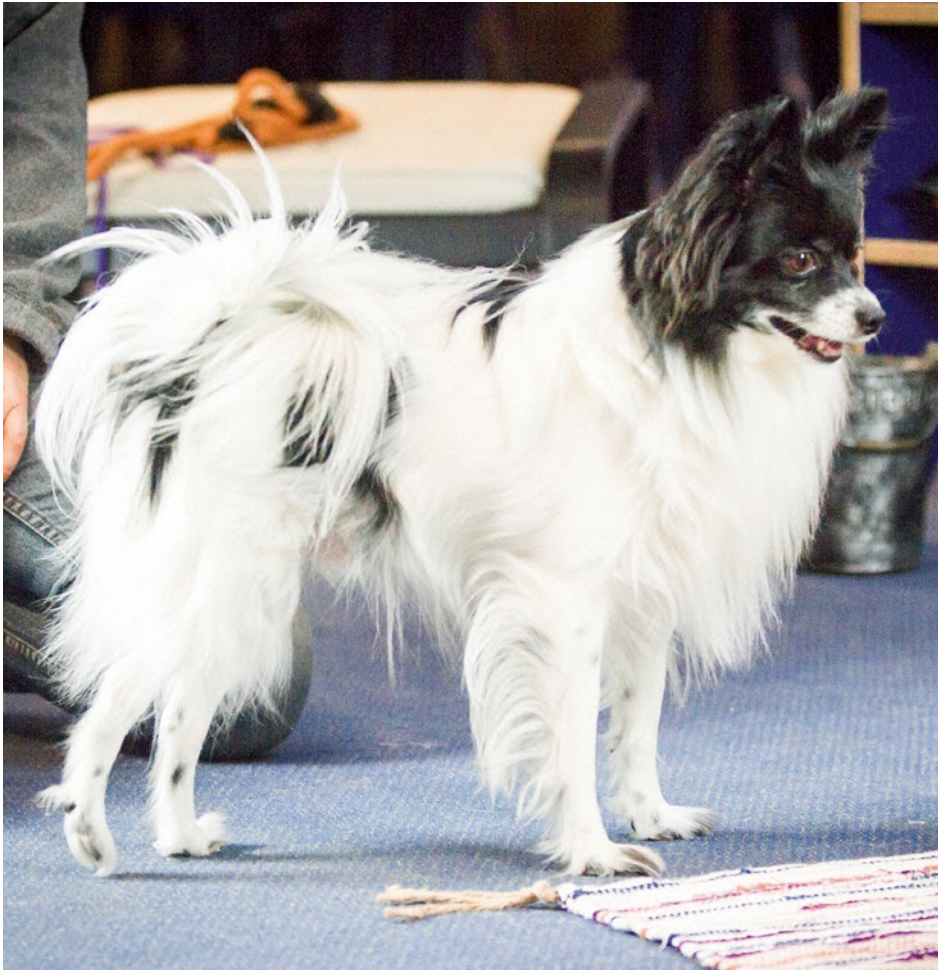
01 ZOS® hilft bei körperlichen Handicaps – hier ein deformiertes Hinterbein.

Formen der Tätigkeit, die dann zum Schluss in einem aktiven Bringen oder anderen, mit Muskelätätigkeit verknüpften Aktivitäten enden. Die Gefahr, dann in einen erneuten übertriebenen Aktivitätsschub zu verfallen, ist bei letztgenannten Tätigkeiten wesentlich höher. Gerade die Zunahme von hyperaktiven und übertrieben nervösen Hunden in unserer Gesellschaft, die nicht zuletzt durch den häufig seitens der Hundehalter verfolgten Beschäftigungswahn noch gefördert wird, schreit geradezu nach konzentrationsfördernden, ruhigen und mit Selbstbeherrschung und Selbstkontrolle verknüpften Tätigkeiten.