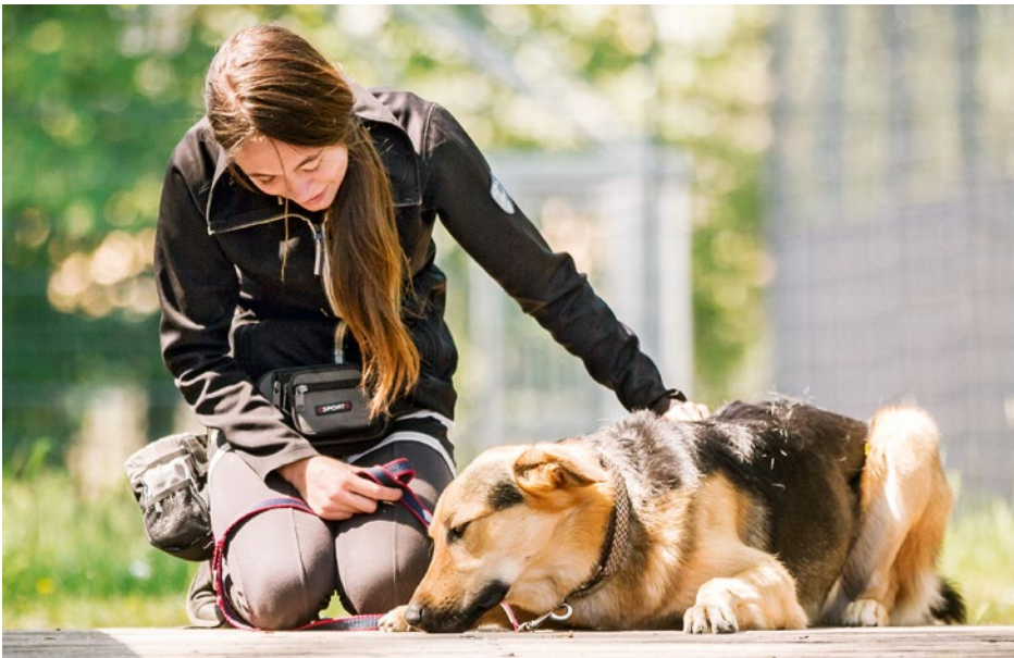
Harmonische Mensch-Hund-Beziehung in der ZOS®-Anzeige.

Vorbereiten Der Zweibeiner steht nun unmittelbar vor seinem Hund. Mit einer Kombination aus spannungsgeladenem Hör- und Sichtzeichen wird die Erwartungshaltung des