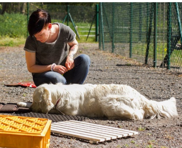
06 Verbales Lob durch den Zweibeiner.

Dauer viel zu einfach und würde damit auch eine unzureichende Auslastung und Beschäftigung nach sich ziehen.