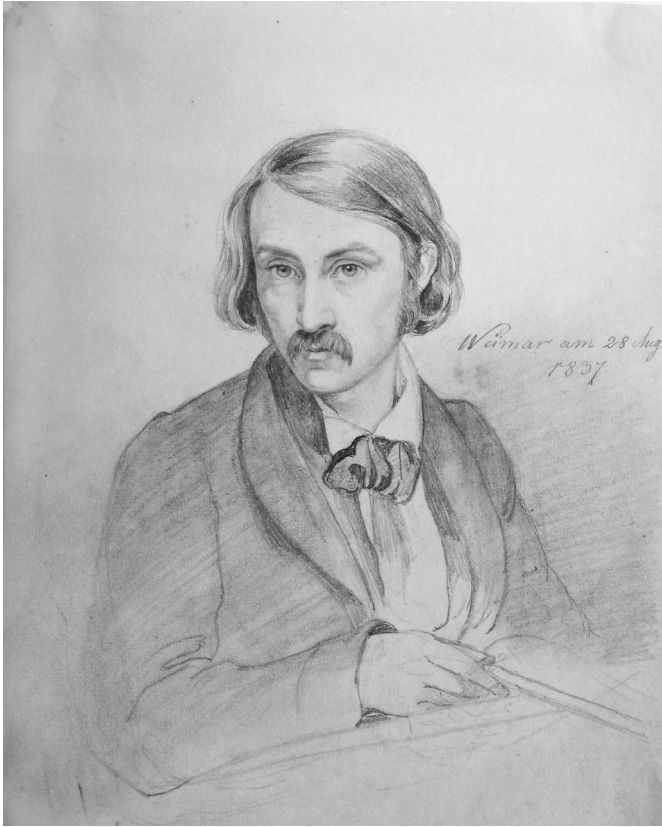
6. Friedrich Preller d. Ä.: Selbstportrait, Zeichnung, 1837.