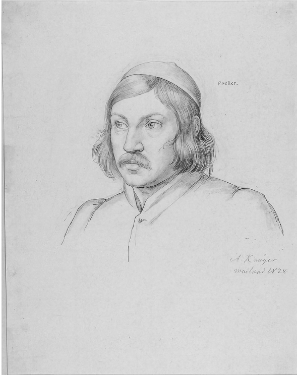
1. Anton Krüger: Friedrich Preller d. Ä., Zeichnung, 1828.

Du diese herrliche Frau. Sie war werth meinen braven Vater durchs Leben zu begleiten; ihre Ehe war nur eine Reihe schöner Bilder und ich wünsche nichts mehr als daß sie es ungetrübt bis an ihr Ende seyn möchte. Wie ergreifend ihre wenigen Zeilen jedes mal für mich sind, kann ich nicht beschreiben, da ihre einzigen Wünsche immer nur die sind, ihre geliebten Kinder wieder bald bei sich zu sehen, von denen sie so früh für so lange Zeit [die folgende Seite fehlt].