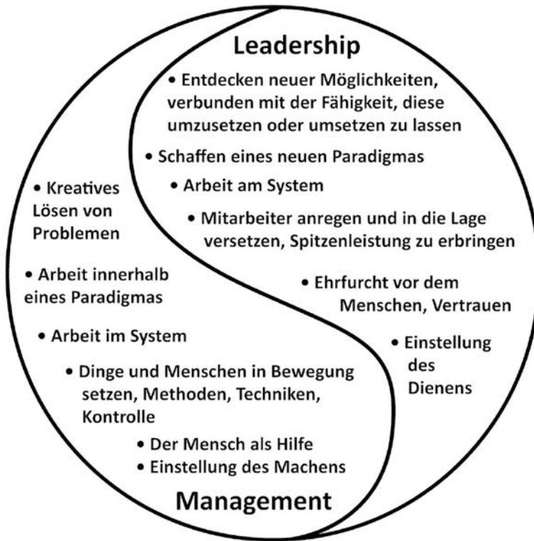
Abb. 2: Die Einheit von Management und Leadership im Yin-Yang-Modell (Hinterhuber 2003, S. 20)

In der Einheit von Yin & Yang gibt es keine klar definierte Grenze, da immer der Anteil des einen (Management) im anderen (Leadership) enthalten und keines ohne das andere möglich ist. Erfolgreiche Schulleitung lebt von starker Ausprägung beider Elemente. Die Unterschiede lassen sich aber verdeutlichen, wenn man sich die jeweiligen Charakteristika als Extreme denkt. So ist Management das kreative Lösen von Problemen, d. h. die Optimierung von etwas Bestehendem, etwa die kluge Organisation eines Vertretungsplans, wenn eine Lehrperson nicht an der Schule sein kann. Bei Leadership geht es um das Entdecken neuer Möglichkeiten, etwa das Erfinden einer Struktur, die verhindert, dass das Fehlen einer Lehrperson zum Problem wird, z. B. durch die Etablierung einer Teamstruktur.