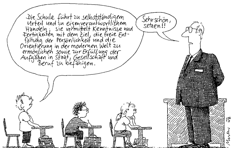
Karikatur »Demokratische Erziehung« von Gerhard Mester

Lange Zeit wurde Demokratie als Unterrichtsstoff verstanden, dessen kognitive Vermittlung Aufgabe des Politikunterrichts sei. Anfang des 21. Jahrhunderts wird ein Umdenken erkennbar: »Galt es bisher als ausgemacht, dass die ›politische‹ Bildung sich auf die Analyse und die Beurteilung ›politischer‹ Fragen im engeren Sinne konzentrieren sollte, so stellen neuere Initiativen ein breiter angelegtes ›Demokratie-Lernen‹ ins Zentrum der didaktischen Bemühungen« (Himmelman 2003).