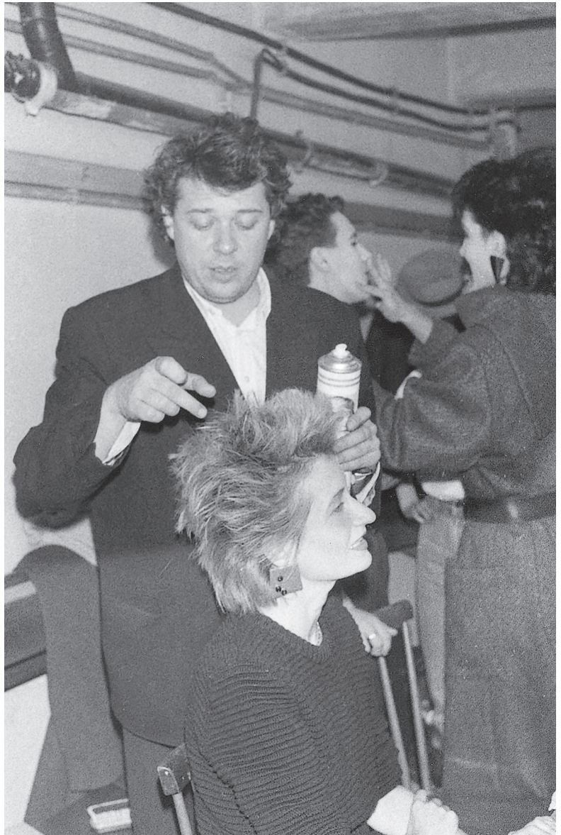
Abb. 1 Hochtoupiert: Elfriede Jelinek im U4, Backstage, Wien.

mich von hinten reingezogen, und die Menschen haben Platz gemacht.» Die sind alle andächtig gestanden und haben mich angeschaut, ob sie auch wirklich reinkommen. Es war ganz nett.