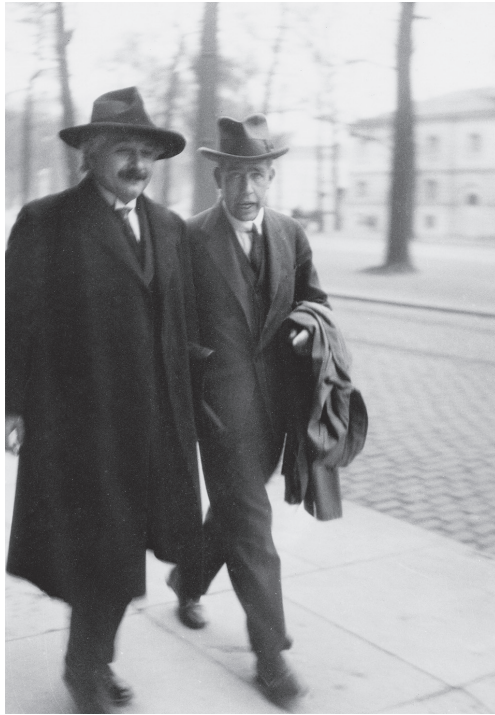
Abb. 3: Albert Einstein und Niels Bohr

Diese Photographie stammt von Paul Ehrenfest, aufgenommen während der Solvay-Konferenz 1930 in Brüssel.