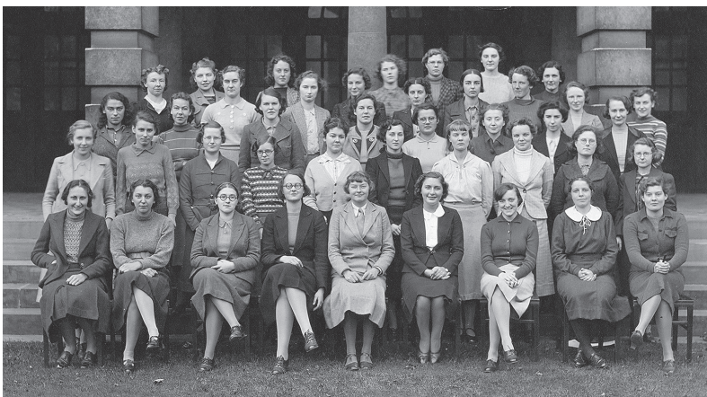
Iris Murdoch (zweite Reihe, Vierte von rechts) und Mary Scrutton (erste Reihe, Vierte von links) auf dem Immatrikulationsfoto, Somerville 1938

waren, Honour Moderations und Literae Humaniores zu studieren. 39 Dieser auf vier Jahre angelegte Studiengang, der besser unter der Bezeichnung Mods and Greats bekannt ist, bestand aus zwei Teilen. Mods umfasste fünf Trimester und schloss mit zwölf jeweils dreistündigen Prüfungen an sieben aufeinanderfolgenden Tagen ab. Die Prüflinge mussten ihnen unbekannte Auszüge aus der griechischen und lateinischen Dichtung und Prosa mühelos übersetzen können. Hatten sie bestanden, dann schloss sich daran ein Studium der Greats über sieben Trimester hinweg an, in dem es um griechische und römische Geschichte, Archäologie, Kunst und Philosophie ging. 40 Außerdem wurde darin auch ein wenig moderne Philosophie bis zu Kant und darüber hinaus (einschließlich Hegel und Marx) gelehrt, zudem etwas Logik, Ethik und politische Philosophie. Den größten Teil des Lehrplans nahm jedoch die antike Philosophie ein, neben ihrer Rezeption im christlichen Denken des Mittelalters. Platons Politeia und Aristoteles' Nikomachische Ethik , die sie auf Griechisch lasen, waren dabei ihre Hauptlektüre. In ihrem ersten Jahr der Greats konnten Iris und Mary unter vierzehn Lektürekursen wählen, die Werken gewidmet waren, welche älter als zweitausend Jahre waren.