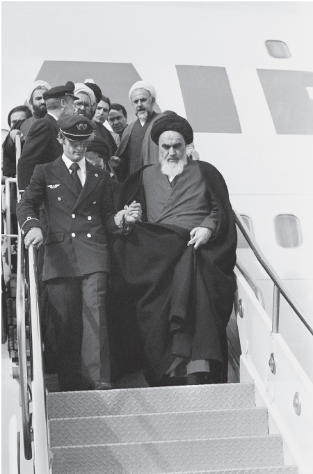
Ayatollah Ruhollah Khomeini bei seiner Rückkehr in den Iran am 1. Februar 1979. Kurz zuvor hatte der letzte Schah das Land verlassen. Khomeinis Fundamentalisten gewannen rasch die Oberhand in der Revolution, und am 1. April wurde die Islamische Republik Iran ausgerufen.

Revolutionsbewegung zunächst eine breite Basis hatte und auch Kommunisten und Demokraten eine wichtige Rolle spielten, gewannen die islamischen Fundamentalisten um Khomeini bald die Oberhand. Am 11. Februar wurde die noch vom Schah gebildete Übergangsregierung gestürzt, 9 und am 30. und 31. März stimmten nach offiziellen Angaben 99,3 Prozent der Wähler für die Ausrufung der Islamischen Republik Iran und eine neue theokratische Verfassung, die am nächsten Tag in Kraft trat. In der Zwischenzeit wurde der Schah wie eine heiße Kartoffel von einem Land ins nächste weitergereicht. Die Flamme breitete sich aus, als er nach Aufenthalt in Ägypten, Marokko, auf den Bahamas und in Mexiko Ende Oktober 1979 zur medizinischen Behandlung in die Vereinigten Staaten einreisen durfte. Zwei Wochen später stürmten radikale Aktivisten die ame-