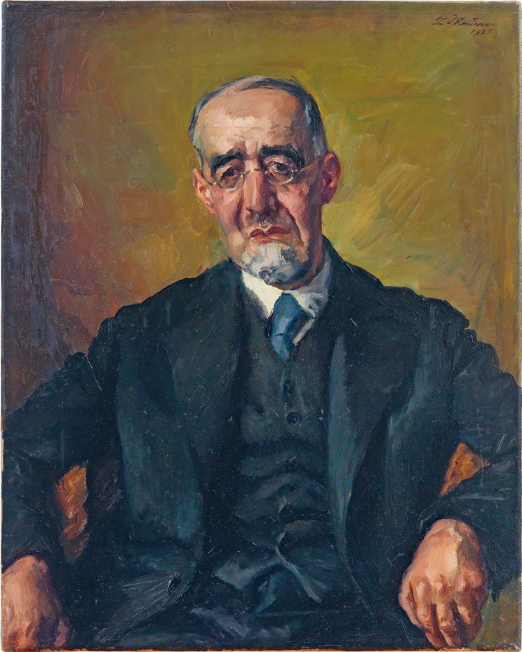
Ludwig Meidner, Porträt Leo Baeck, 1931, Öl auf Leinwand, Jüdisches Museum Berlin