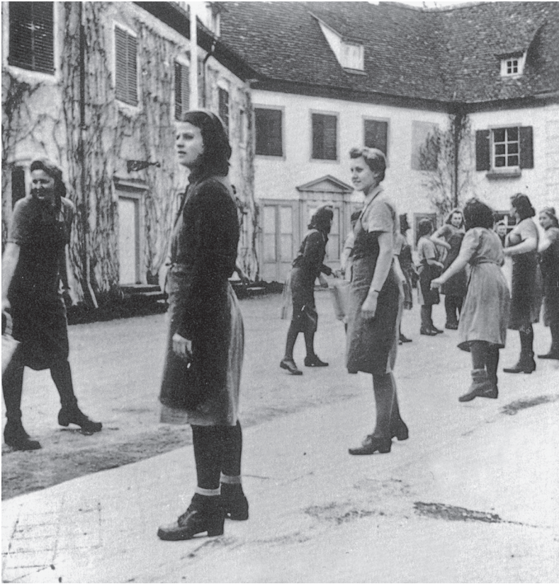
Sophie Scholl (2. v. li.) im Reichsarbeitsdienst, Krauchenwies, Frühjahr 1941