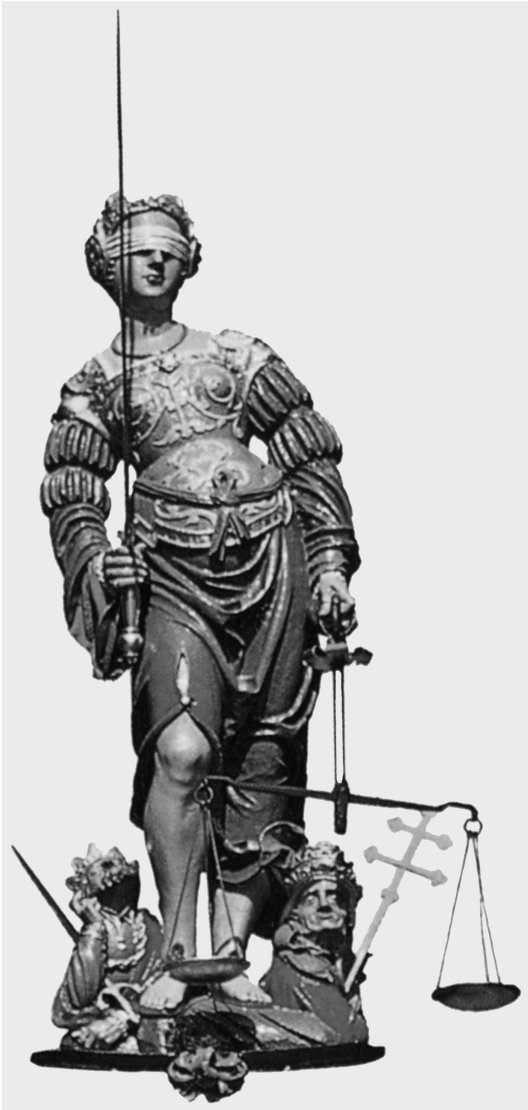
Abb. 1: Berner Gerechtigkeitsbrunnen, Ausschnitt