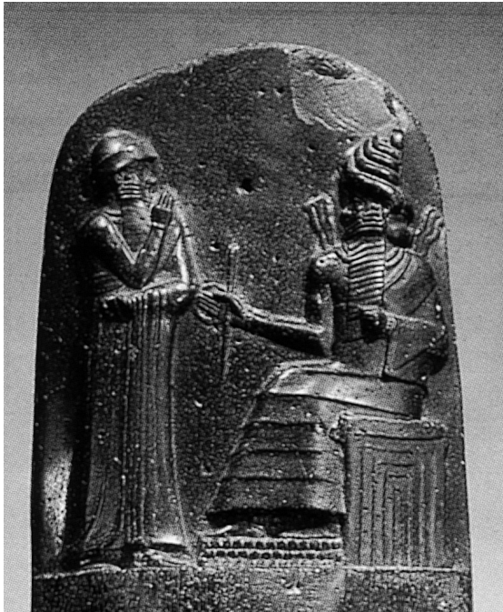
Abb. 2: Kodex Hammurapi, 17. Jh. v. Chr.

ziehungen gilt. Ebenfalls zum gemeinsamen Gerechtigkeitserbe gehört der Gedanke einer ausgleichenden («korrektiven») Gerechtigkeit. Im Zivilrecht verlangt er den Ausgleich für erlittene Schäden und im Strafrecht den für ein verschuldetes Unrecht. Ferner werden so gut wie allerorten dieselben Grundrechtsgüter geschützt. Überall werden Mord, Diebstahl und Raub sowie Beleidigungen, ferner Maß-, Gewichts- und Urkundenfälschungen, nicht zuletzt elementare Umweltverstöße, früher beispielsweise Brunnenvergiftungen, geahndet. Einigkeit herrscht schließlich über das Gebot, nur Schuldige zu bestrafen, und das Anschlussgebot, leichtere Verstöße gegen das Strafrecht leichter, schwerere Verstöße schwerer zu bestrafen. Die Gemeinsamkeiten sind also eindrucksvoll groß, so dass die globale Zivilisation, die sich