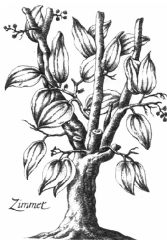
Abb. 1: Zimtbaum.

Zuletzt sei noch auf ein in der bisherigen Literatur fast völlig übersehenes Objekt hingewiesen, ein Stück getrocknete Rinde des Zimtbaums, das der Kurfürst 1493 von seiner Reise mitgebracht haben soll und welches sich anders alle sonst bezeugten Mitbringsel dieser Reise zumindest noch im 19. Jahrhundert im Gothaer Schloss Friedenstein befand: ein Stückchen Zimmetholz [...], welches Friedr.[ich] aus dem heil.[igen] Lande mitgebracht haben soll 64 .