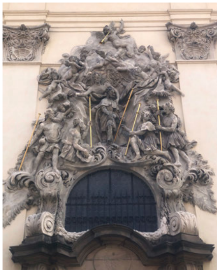
Abb. 4: Ottavio Mosto: Hl. Jakobus als Schutzpatron der Pilger, 1695–1701, Stuckrelief, St. Jakobuskirche, Prag.

im Jahr 1318 wurden die Kirche und das Kloster vom Königspaar Johann von Luxemburg und Eliška Přemyslovna (Elisabeth von Böhmen) (1292–1330) aufwendig wiederaufgebaut. Die Bauarbeiten an der Klosterkirche dauerten bis 1374, als der Prager Erzbischof Johann Očko von Vlašim (nach 1315–1380) die Kirche weihte. Dominiert wurde die Kirche von drei Türmen, was für Bauten der Minoriten untypisch ist. Zur Zeit der Hussitenkriege wurde das Kloster vor der Zerstörung bewahrt. Der Umbau erfolgte unter der Herrschaft Rudolfs II. (1552–1612) am Ende des 16. Jahrhunderts. Im Jahr 1689 brannten die Kirche und ein Teil des Klosters nieder. Mit dem Wiederaufbau wurde der Architekt Johann Simon Pánek (1654–1734) betraut. An der Fassade befinden sich große Stuckskulpturen von Ottavio Mosto 26 (1659–1701) aus den Jahren 1695–1701, (Abb. 4) die die Heiligen Franz von Assisi, Antonius von Padua und den heiligen Jakobus als Pilger darstellen. Den Hauptaltar ziert ein Gemälde des hervorragenden Hochbarockmalers Wenzel Lorenz Reiner (1689–1743) mit dem Motiv des Martyriums des hl. Jakobus 27 .