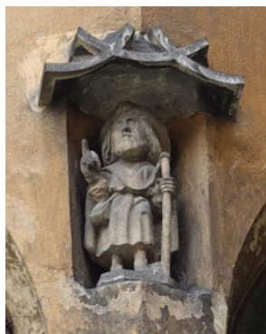
Abb. 9: Hl. Jakobus, Statue im Außenbereich der Jakobskapelle, um 1500, St. Mariä-Himmelfahrtkirche, Glatz.