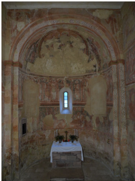
Abb. 3: Zyklus aus dem Leben des hl. Jakobus, letztes Viertel des 12. Jahrhunderts, Fresco-secco-Malerei, St. Jakobskirche in Rovná bei Stříbrná Skalice (Silber Skalitz).

Mit dem Erwerb von Reliquien des heiligen Jakobus durch Ottokar I. Přemysl (um 1160–1230) ist die Entstehung der spätromanischen Jakobskirche in der Prager Altstadt verbunden 25 . Die ursprüngliche Verfassung der Kirche ist nicht bekannt. Wenzel I. (um 1205–1253), der Sohn von Ottokar I. Přemysl, rief die Minoriten nach Prag und ließ sie in der ursprünglichen Jakobskirche ansiedeln. Diese wurde abgerissen und an ihrer Stelle wurde 1232 der Grundstein für eine neue Klosterkirche gelegt. Die Fertigstellung des Klosters erfolgte im Jahr 1244. Die Lage des Klosters war wichtig, denn es befand sich in der Nähe des Altstädter Ringes und des so genannten Ungeltes, wo der Zoll von den Kaufleuten erhoben wurde. Welche Bedeutung das Kloster für die böhmischen Herrscher besaß, beweist die Tatsache, dass im Refektorium des Klosters das Krönungsbankett von König Johann von Luxemburg (1296–1346) stattfand. Infolge eines Brandes