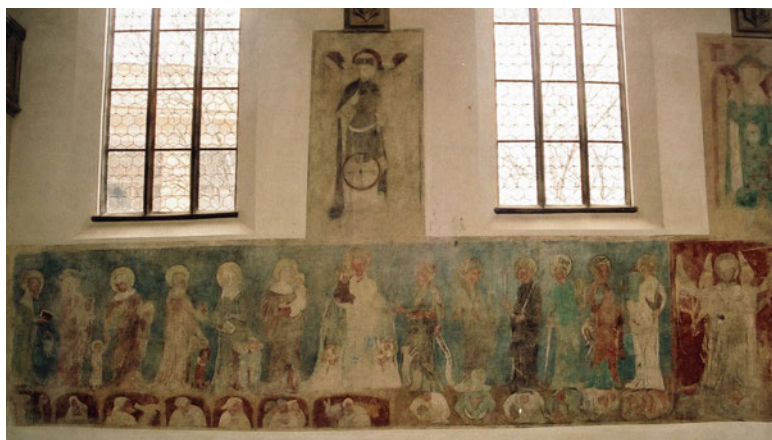
Abb. 1: Verwandtschaft Christi, Heilige Sippe, Schutzmantelmadona, Heilige Jungfrauen – Märtyrerinnen, St. Wenzel um 1380, Fresco-secco-Malerei, Prag, St. Apollinariskirche.

nicht-kanonisches Thema, das sich zwar auf neutestamentliche Texte bezieht (Mt 12,46; 27,56; Mk 15,40; Joh 2,12; 7,3–5; 19,25; Gal 1,19), aber auf die Schriften kirchlicher Schriftsteller wie Bischof Haymo von Halberstadt (reg. 840–853), Fulbert von Chartres (um 950–1028/1029), die Goldene Legende des Jakobus von Voragine (um 1228–1298) und die Offenbarung der heiligen Colette Boille (1380–1447) zurückgeht. Der Goldenen Legende zufolge war die hl. Anna dreimal verheiratet (Trinubium Sanctissimae Annae). Aus jeder Ehe ging eine Tochter mit dem Namen Maria hervor. Aus der Ehe mit Joachim wurde die Jungfrau Maria geboren, aus der Ehe mit Kleophas die Maria des Kleophas und schließlich aus der Verbindung mit Salomas die Maria Salome. Diese drei Marien heirateten ebenfalls und bekamen Kinder: Die Jungfrau Maria war mit Josef verlobt und empfing Christus durch den Heiligen Geist. Maria Kleophas heiratete Alphäus, mit dem sie vier Söhne hatte: Jakobus den Jüngeren, Josef den Gerechten, Simon und Judas Thaddäus. Die dritte Maria heiratete Zebedäus, einen Fischer aus Galiläa. Sie bekamen zwei Söhne: Jakobus den Älteren und Johannes den Evangelisten. Auf einem Wandgemälde aus den 1380er Jahren in der Prager Kirche St. Apollinaris findet sich eine der ältesten Darstellungen des Trinubium-Themas in Europa 2 .