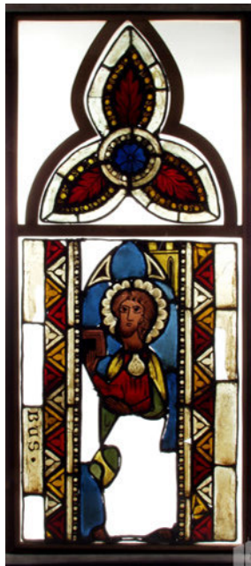
Abb. 6: Hl. Jakobus, Glasmalerei, 2. Viertel des 14. Jahrhunderts, Westböhmisches Museum in Pilsen.

Die wahrscheinlich älteste Darstellung des hl. Jakobus mit dem Attribut der Pilgermuschel findet sich in Böhmen auf einer Glasmalerei (2. Viertel des 14. Jahrhunderts) aus der St. Jakobs-Kirche in Žebnice (Zebnitz, Schebnitz) (Abb. 6), die sich heute im Diözesanmuseum in Pilsen befindet (Eigentum des Westböhmisches Museums in Pilsen) 29 .