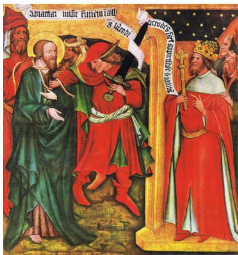
Abb. 5: Meister der Kreuzigung aus Raigern: Gefangennahme des hl. Jakobus, um 1436, Tafelmalerei, Nationalgalerie Prag.

Für die Prager Jakobuskirche – nach anderen Meinungen für die St. Jakobus – Kirche in Brünn – wurde ein Altarretabel mit Motiven aus dem Leben Christi und des hl. Jakobus vom Meister der Kreuzigung aus Raigern (1410–1440) in Auftrag gegeben. Es wird angenommen, dass der Altar um 1436 vom Kaiser und König Sigismund von Luxemburg (1368–1437) in Auftrag gegeben wurde, um die während der Hussitenkriege zerstörten Werke zu ersetzen. 28 Erhalten blieben fünf Tafeln mit marianischen Themen (Verkündigung Mariä, Mariä Heimsuchung, Anbetung Christi, Anbetung der Könige, Opfer Christi) und acht mit dem von der Legenda aurea inspirierten Jakobszyklus. Vier Tafeln mit Jakobusthemen befinden sich in der Nationalgalerie in Prag (Hermogenes schickt Philetus zu Jakobus, Philetus bindet Hermogenes los, Hermogenes erhält das Zeichen, Gefangennahme des hl. Jakobus), (Abb. 5) eine Tafel (Die Enthauptung des hl. Jakobus) in der Mährischen Galerie in Brünn, zwei Tafeln (Jakobus schickt Philetus den Schleier, Jakobus heilt den Kranken) in österreichischem Privatbesitz und eine Tafel (Die Überführung des Leichnams des Heiligen) im Kunsthistorischen Museum in Wien. An den Aussentafeln des