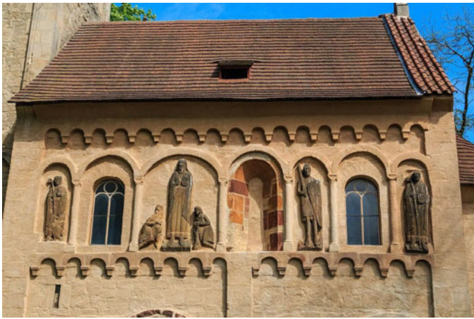
Abb. 2: St. Jakobus mit Stiftern und die Figuren der böhmischen Landespatronen St. Wenzel, St. Adalbert und St. Prokopius, um 1165, Steinrelief, Jakob bei Kuttenberg.

Westen. An der Westmauer stand eine Herrschaftstribüne. An den Wänden des Kirchenschiffs befinden sich Wandmalereien mit Szenen aus dem Leben der Jungfrau Maria und des heiligen Nikolaus aus den Jahren 1170–1240. Unter dem Chorraum sind Bruchstücke des Lebenszyklus des heiligen Prokop zu sehen. Beherrschendes Thema in der Apsiskonche ist die Majestas Domini mit den Symbolen der Evangelisten. Im unteren Bereich sieht man einen Streifen mit den Aposteln und noch weiter unten Fragmente der Legende aus dem Leben des heiligen Jakobus.