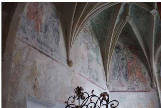
Abb. 8: Jakobskapelle, um 1500, St. Mariä-Himmelfahrtkirche, Glatz. Foto: Jan Royt.

Die Grafschaft Glatz (pl. Kłodzko, tsch. Kladsko) war zwischen 1137 und 1742 Teil der historischen Länder der Böhmisches Krone. Aus diesem Grund erwähne ich die bemerkenswerte Jakobskapelle aus der Zeit um 1500, die aus dem südlichen Seitenschiff der Kirche der Mariä Himmelfahrt in Glatz herausragt 35 . Die Konsolen, aus denen die Rippen des Gewölbes herausragen, haben die Form von Jakobsmuscheln. (Abb. 8, 9) An der Außenseite der Kapelle befindet sich eine Nische mit einer kleinen spätgotischen Statue des hl. Jakobus in Pilgerkleidung. Die Kapelle wurde von der Jakobusbruderschaft genutzt 36 .