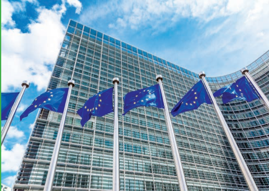
Europäisches Parlament in Straßburg