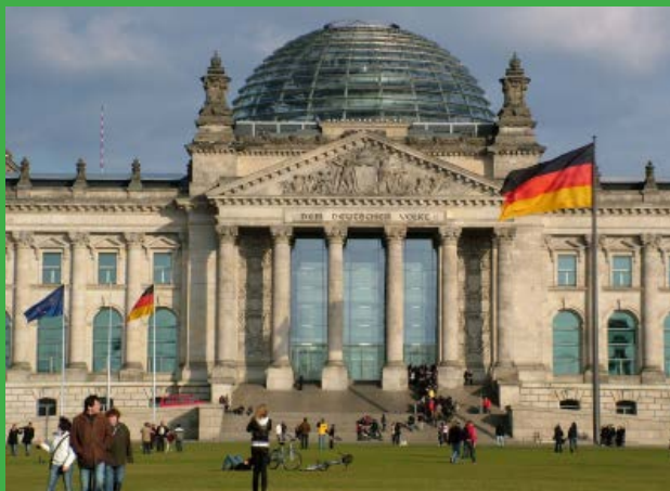
Reichstag in Berlin, Sitz des Bundestags