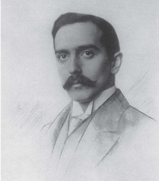
Abb. 9: Bleistiftzeichnung von Hans Kelsen, 1906/07.