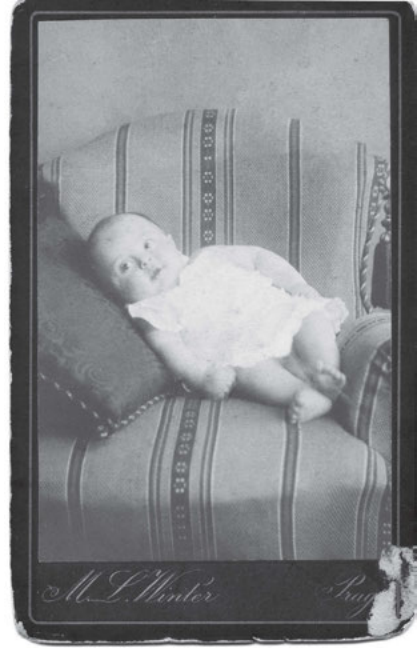
Abb. 3: Das Geburtshaus Hans Kelsens in Prag, Spálená ulice 64 (1970 abgerissen). Abb. 4: Hans Kelsen, ca. 1881/82.