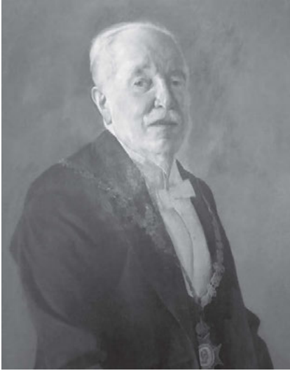
Abb. 10: Adolf Menzel, ca. 1915.