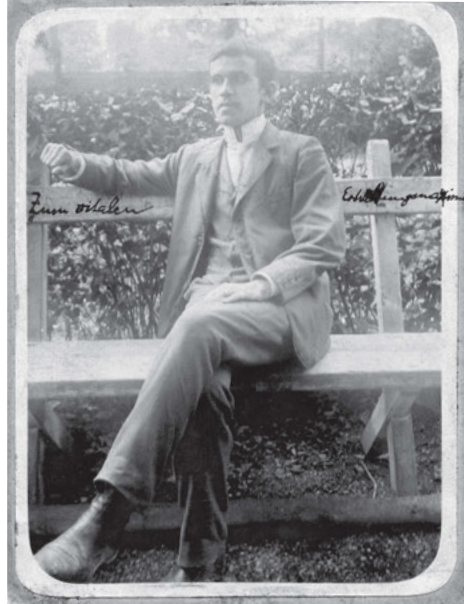
Abb. 12: Otto Weininger. Foto mit handschriftlicher Widmung an Hans Kelsen: »Zum vitalen Erholungsmaximum«.