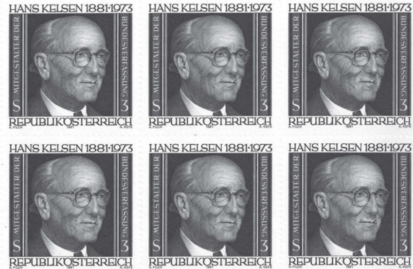
Abb. 1: Sonderbriefmarke der österreichischen Post zum 100. Geburtstag Hans Kelsens.