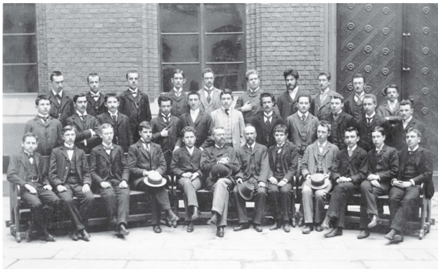
Abb. 7: Maturafoto des Jahrganges 1900 im Akademischen Gymnasium Wien. Hans Kelsen in der 2. Reihe, 2. von links; Ludwig v. Mises vermutlich 2. Reihe 3. von links.