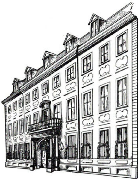
Fassade des Kurpfälzischen Museums