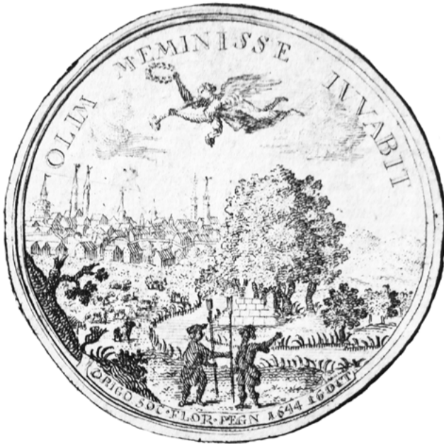
Abb. 4: Amarantes [= Johann Herdeggen]: Historische Nachricht von deß löblichen Hirten- und Blumen-Ordens an der Pegnitz Anfang und Fortgang/ biß auf das durch Göttl. Güte erreichte Hundertste Jahr [...]. Nürnberg 1744, Titelblatt (Vergrößerung eines Ausschnitts)

So wundert es nicht, dass das Motiv der beiden Schäfer 100 Jahre später noch einmal von der geschichtlichen Darstellung des Blumenordens aus der Feder von Amarantes aufgegriffen worden ist. Dieser bildet auf dem Titelkupfer seiner Geschichte des Blumenordens eine Gedenkmedaille ab, die zugleich auch das (angeblich) genaue Gründungsdatum der Sozietät namhaft macht. 8 In direkter Anlehnung an das Frotispiz der Pegnesis weist einer der beiden – ununterscheidbaren – Herren dynamisch in die Ferne, während über Schafen, Ruine, Bäumen und Stadtsilhouette diesmal Fama den Blumenkranz schwingt, mit dem der Sieger im Dichterwettbewerb ausgezeichnet werden soll. Die zum Blasen erhobene Posaune macht zugleich deutlich, dass der Ruhm der beiden Poeten weit in die Welt hinaus erschallen wird – daran werde, ja müsse man sich einstens erinnern, wie das Lemma nahelegt.