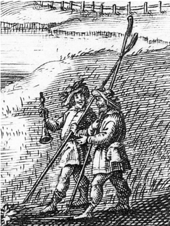
Abb. 1: [Georg Philipp Harsdörffer / Johann Klaj:] Pegnesisches Schaefergedicht/ in den Berinorgischen Gefilden/ angestimmt von Strefon und Clajus. Nürnberg 1644, Titelkupfer (Ausschnitt)

Aus derselben [der Heimat von Clajus] hat das rasende Schwert/ die Rache der gefluchten Beleidigung/ und das wütende getümmel der Waffen unlängst alle Kunst und Gunst verjaget: Schäfer und Schäferinnen sind um ihre liebe Wollheerde gebracht/ alle Dörfer/ Mayerhöf/ Forwerge und Schäferereien sind verödet/ Auen und Wiesen verwildert/ das Gehölzt durch die Wachfeuere verösiget/ Obst- und Blumgärten zu Schantzen gemacht worden [...]: darum dann auch Klajus/ ein namhafter Schäfer/ aus selbigen Orten fortgemachet/ welchem nach vielen wandelbaren Unglücksfällen sein Verhängnis an den Pegnitzfluß geführet. 4