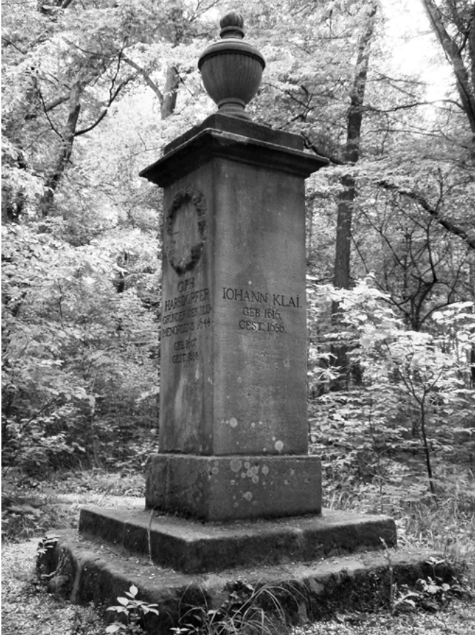
Abb. 5: Gedenkstein im Irrhain der Pegnitzschäfer bei Kraftshof

auf der Schauseite eines Gedenksteins im Irrhain bei Kraftshof ausschließlich den Nürnberger Patrizier Harsdörffer als Gründer und ersten Präses verewigt – für den jüngeren, oft originelleren, aber dann wieder aus der Reichsstadt abgewanderten sächsischen Migranten (ebenso wie für seinen aus Böhmen stammenden Kollegen Betulius/Birken) blieb es bei einer unkommentierten Nennung ‚am Rande‘. 37