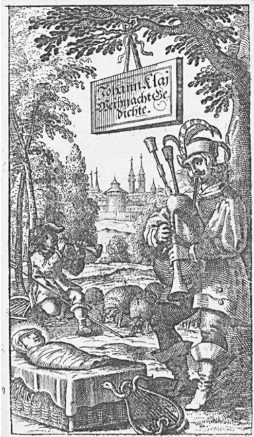
Abb. 2: Johann Klaj: Weihnacht Gedichte . Nürnberg 1648, Titelkupfer

Das Titelkupfer der Weihnacht Gedichte (1648) 7 zeigt indes im Vordergrund eine einzelne Figur mit zeittypischer Sackpfeife, die trotz des bäuerlichen Instruments eher an den gepflegten Begleiter des Vollbärtigen erinnert: