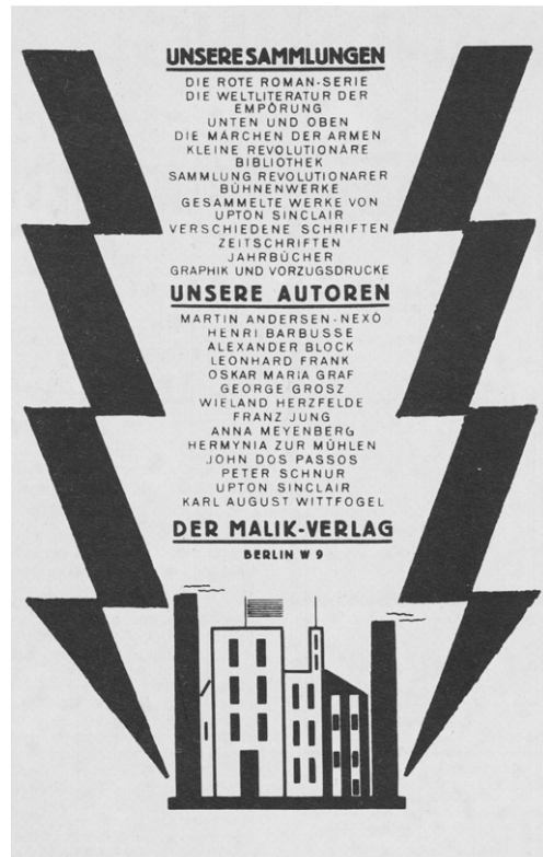
Abb. 4: Malik-Verlagsanzeige 1924. In: Der Malik-Verlag 1916–47. Chronik , S. 64.

Seit 1920 gingen daher auch die Zeitschriftentitel zurück und der Buchverlag etablierte sich, im Umfang durchaus vergleichbar mit der Rowohlt-Produktion. Im Mittelpunkt stehen etwa 80 Autoren aus der Sowjetunion, 1924 z. B. Wladimir Majakowskis 150 Millionen in der Übersetzung von Johannes R. Becher, es folgten einzelne Werke und Ausgaben von Ilja Ehrenburg, Maxim Gorki, Sergej Tretjakow, daneben zwischen 1926 und 30 eine 17-bändige Gesamtausgabe von Maxim Gorki, die Gesamtausgabe von Ehrenburg und ab 1928 auch die Gesamtausgabe von Tolstoi. 167