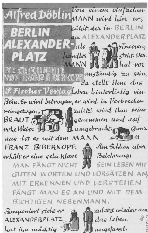
Abb. 3: Georg Salter: Schutzumschlag als Bild- und Textcollage für Alfred Döblins Roman »Berlin Alexanderplatz«, Oktober 1929.

dem Wunsch: »Mögen die Erben Deines Werkes es mit Klugheit und ohne schimpfliche Nachgiebigkeit hinüber retten in Zeiten, die von großen humanen Ideen wieder etwas verstehen werden.« 42