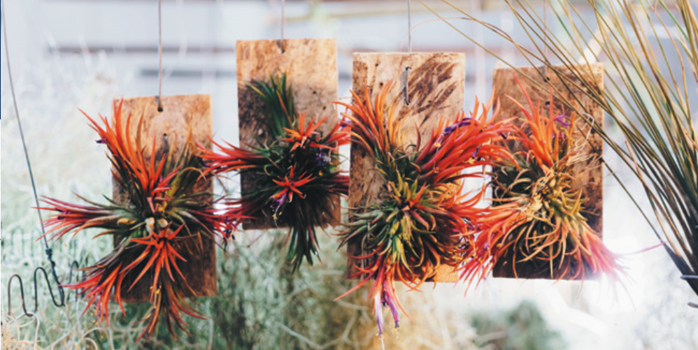
Tillandsias fixés sur des plaques de bois.