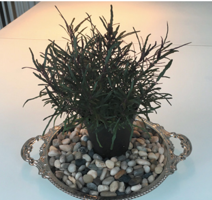
Plante placée sur un plateau humidifiant.

Certaines plantes souffrant d'un manque d'humidité durant l'hiver sont trop grosses pour un terrarium. Il est possible de les enfermer dans un sac de plastique transparent pour l'hiver. On ne doit pas craindre que les plantes qui poussent dans un sac scellé meurent asphyxiées, elles produisent elles-mêmes l'air nécessaire pour leur respiration (oxygène le jour et dioxyde de carbone la nuit). Utiliser des bâtons pour éloigner la paroi. Ouvrir le sac pour quelques heures si des gouttes d'eau se forment.