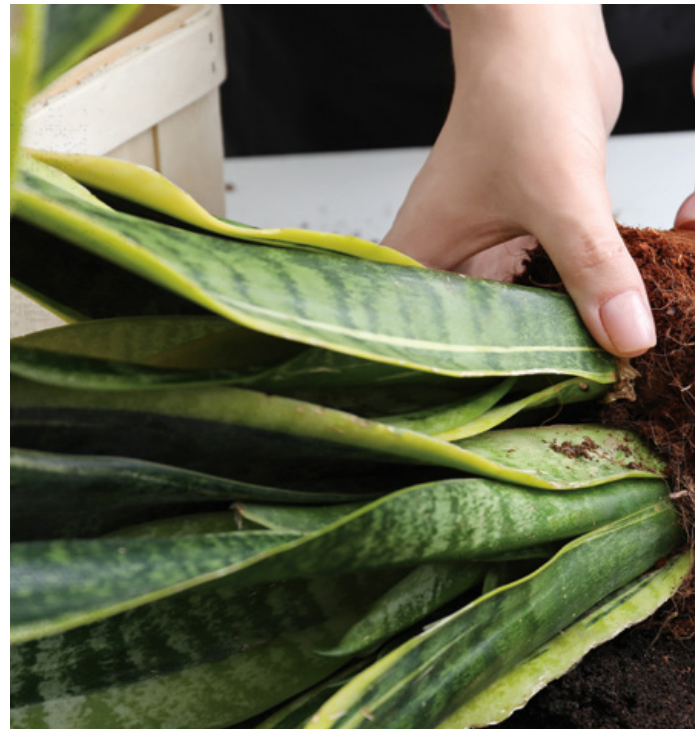
Faire tomber une partie de l'ancien terreau.

Certains signes indiquent qu'il est temps de repoter, même si une plante l'a été depuis moins d'un an : une plante qui commence à se flétrir à peine quelques jours après un arrosage en profondeur signale que son système racinaire est tellement développé qu'il manque d'espace. Il faut la repoter dans un plus gros pot. Une plante qui se renverse est aussi devenue trop grosse pour son pot et a besoin d'un pot plus grand. Lors du repotage, il peut également être utile d'utiliser un pot plus lourd ou un terreau plus pesant, comme celui pour plantes succulentes et cactées. Enfin, quand une croûte blanchâtre ou jaunâtre commence à se former sur la paroi du pot ou sur la tige des plantes, c'est signe qu'une quantité excessive de sels minéraux commence à s'accumuler. On doit alors empoter dans un terreau frais ou lessiver à fond et faire un surfaçage.