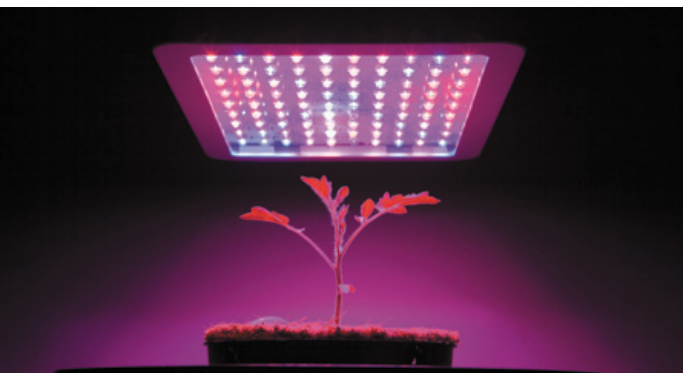
Les lampes DEL à l'éclairage rosé donnent aux plantes une apparence sombre et désagréable à l'œil.

feuillage soit réchauffé, entre 15 à 30 cm. Vous pouvez utiliser des lampes fluorescentes tout à fait ordinaires et bon marché, comme des Cool White et des Warm White, notamment en combinaison.