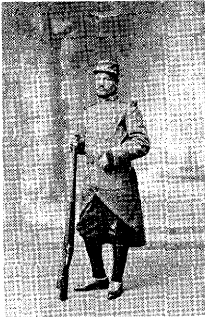
Oruno Lara, en 1914