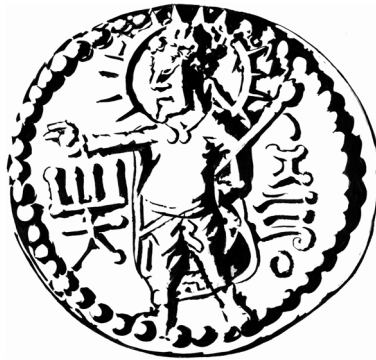
Monnaie Kushana, représentation de Mithra

UN DISPOSITIF ÉDITORIAL THÉMATIQUE. — Autour d'un thème ou d'une problématique, chaque numéro de MEI « Médiation et information » est composé de trois parties. La première est consacrée à un entretien avec les acteurs du domaine abordé. La seconde est composée d'une dizaine d'articles de recherche. La troisième présente la synthèse des travaux de jeunes chercheurs.