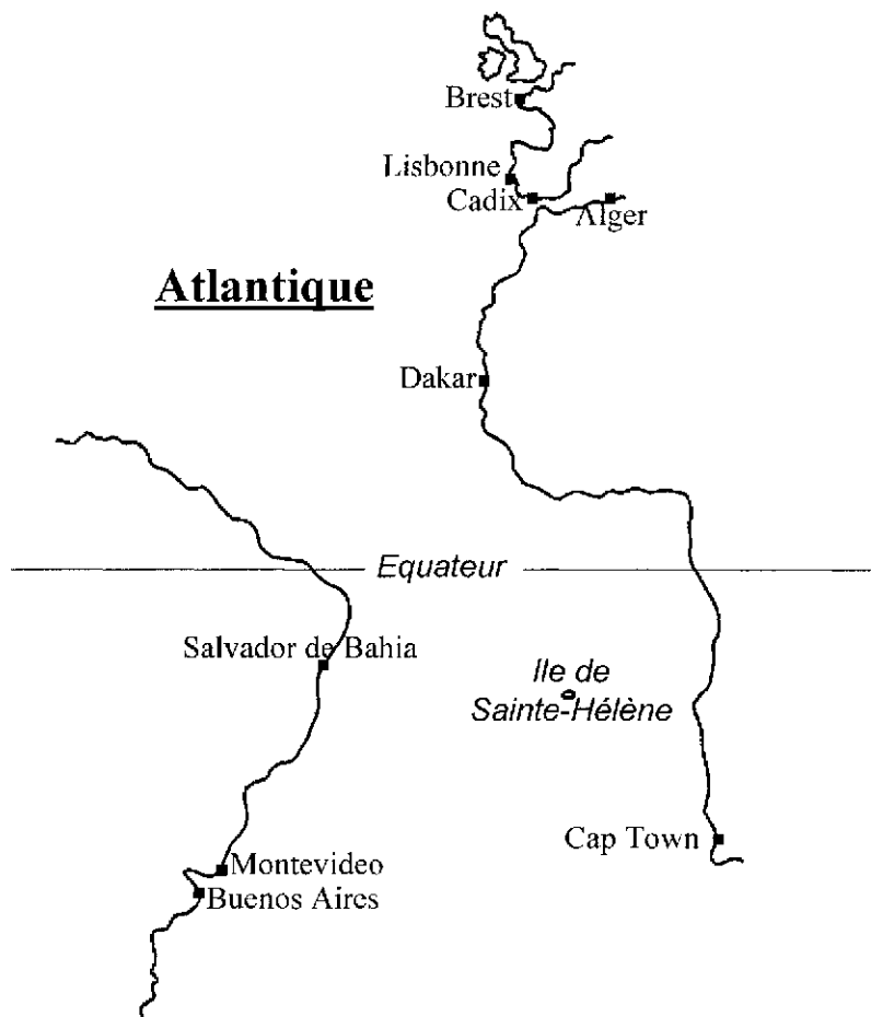
Principales escales dans l'Atlantique de la campagne d'instruction sur le Duguay-Trouin

L'Atlantique traversé, se dessine la côte du Brésil et la baie de Bahia avec ses églises coloniales ornées d'or ; au delà, appuyés au