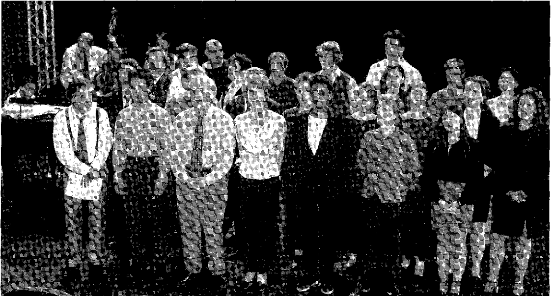
Les enfants du printemps

Secrétariat de rédaction : Clotilde Delarue.