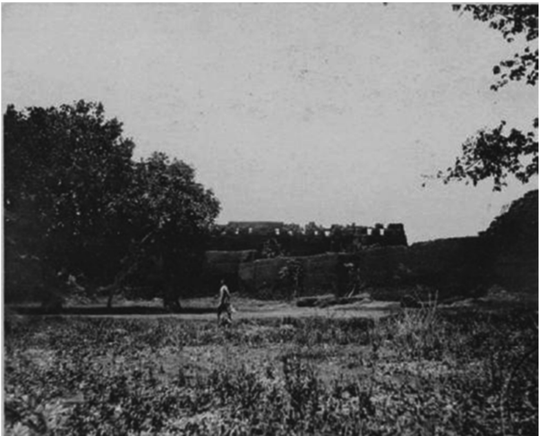
Photo n°1 : Ruines de la maison à étage, édifiée par le roi Agaja vers 1720

souci de se protéger contre toute attaque ennemie dans l'espace inaccessible d'une citadelle ; un peu comme les châteaux. Dans le palais, on célébrait et magnifiait la grandeur, la puissance et la majesté des souverains du Danhomè. En plus, la vie privée du roi, que son caractère sacré plaçait au-dessus des simples mortels, devait être protégée des regards des gens vulgaires. Une grande discrétion devait de plus entourer la vie des nombreuses épouses du monarque. Dans l'enceinte du palais se déroulait également un grand nombre d'activités qui réglaient la vie des courtisans, parents et serviteurs du roi. Le palais enfin se devait d'être une œuvre artistique, reflet d'une société organisée, férue d'art, soucieuse de léguer à la postérité, son histoire, sa civilisation 13 .