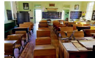
C'est une salle de cours.