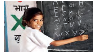
C'est une étudiante.