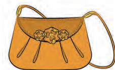
C'est un sac.